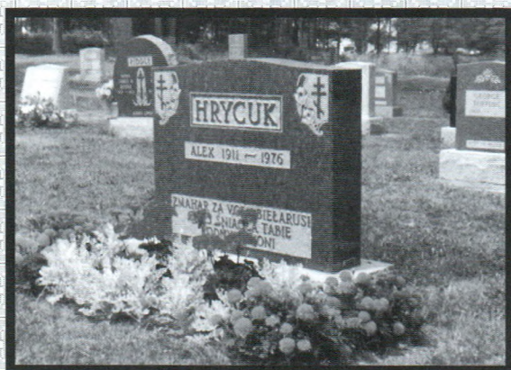
◀ Апошні прытулак. Могілі, г. Кінгстан