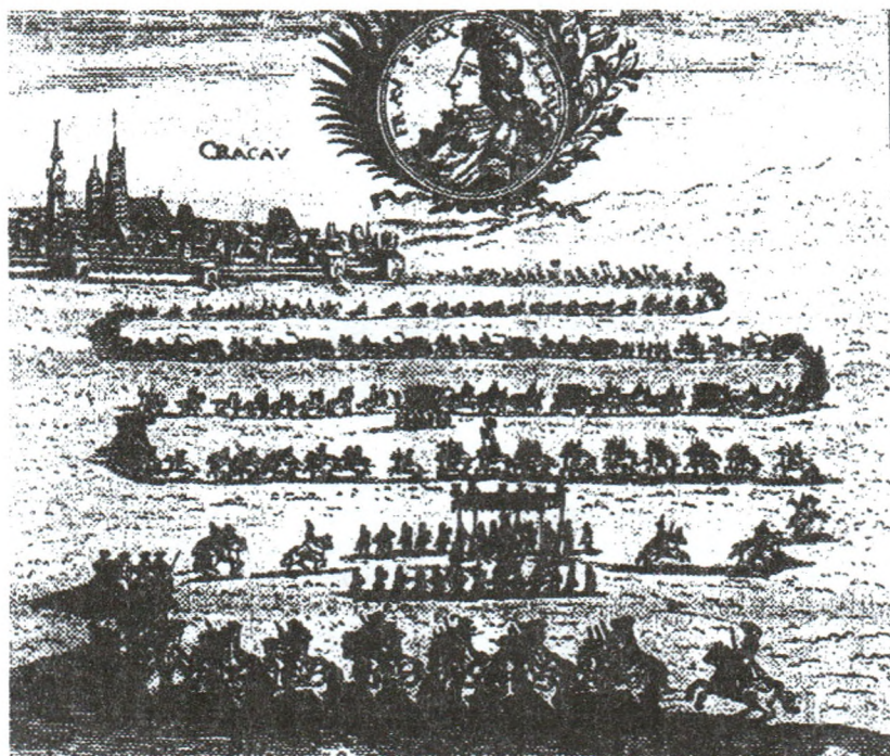
Каранацыя Аўгуста II у Кракаве

Толькі 25 ліпеня скіраваліся да Кракава. Саксонец да пары не даваў волі жаўнерству, дзе грашамі, дзе ўгаворамі ды абяцанкамі схіляў на свой бок уплывовых людзей. Праз таго ж махляра Пшэбэндоўскага плаціў запознены жолд кароннаму войску і рэгімэнты, прызнаваўшыя дагэтуль князя Канці, тлумна