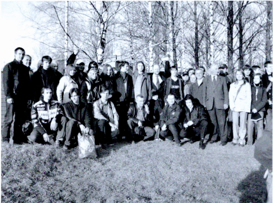
Асуджаных за пратэст супраць інаўгурацыі Лукашэнкі сустракаюць паплечнікі