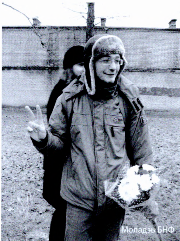
Радасьць быць на волі. Антон Каліноўскі пасля адбыцьця арышту