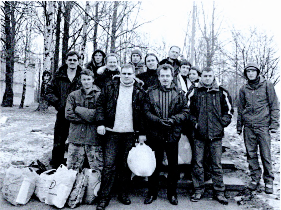
Удзельнікі мітынгу прадпрымальнікаў пасля вызваленьня з Акрэсьціна