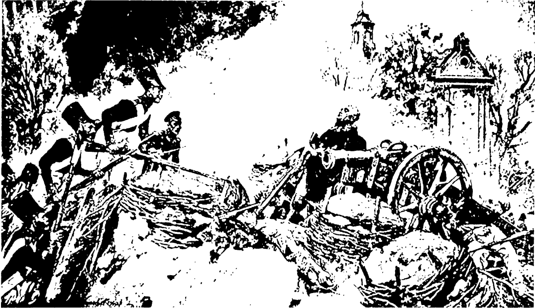
Смерць генерала Савінскага (1831 г.).

га пахавання генерала Савінскага. Яго магіла паблізу касцёла была датуль мэтаі шматлікіх патрыятычных паломніцтваў, і досыць адмысловым чынам хацелі пакласці гэтаму капец. Аднак безвынікова — з цягам часу жыхары Варшавы і гэтае месца пачалі трактаваць як месца пахавання Савінскага.