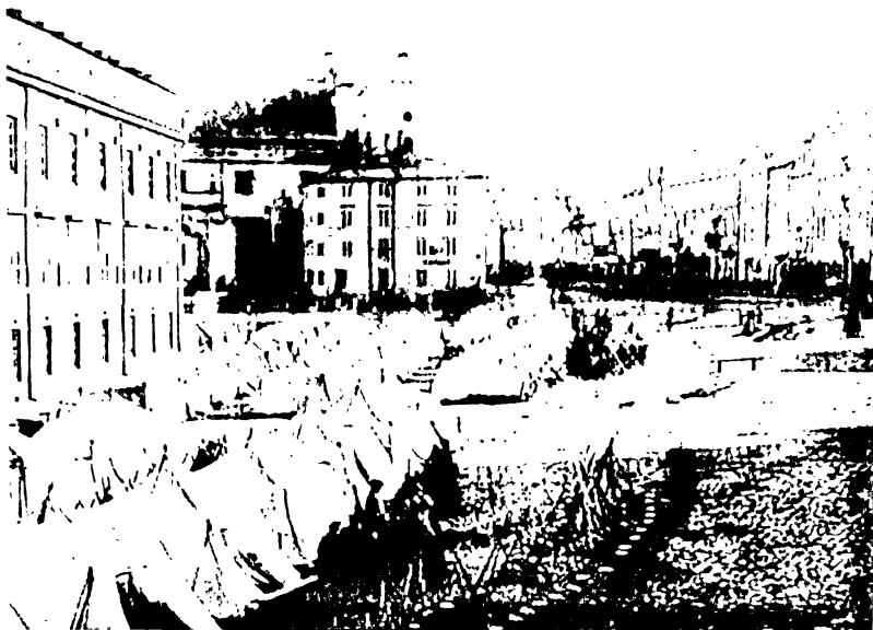
Расійскі лагер на Замкавай плошчы (1863), французская гравюра.

Зборны пункт і баракі ў Празе — Санкт-Пецярбургская (сёння Сталінградская), 501 (124 мураванья і драўляныя будынкі).