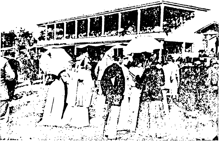
Сцэна з конных скачак (1891—1892).

Уся польская грамада сярэщаная, бы квеценню, афіцэрскімі мундзірамі. Кабеты-полькі фліртуюць з афіцэрамі, мужчыны-палякі перапрадаюць ім з ветлівасці найлепшых коней і дбаюць пра тое, каб колькасць узнагарод дзялілася пароўну паміж расійцамі і палякамі,