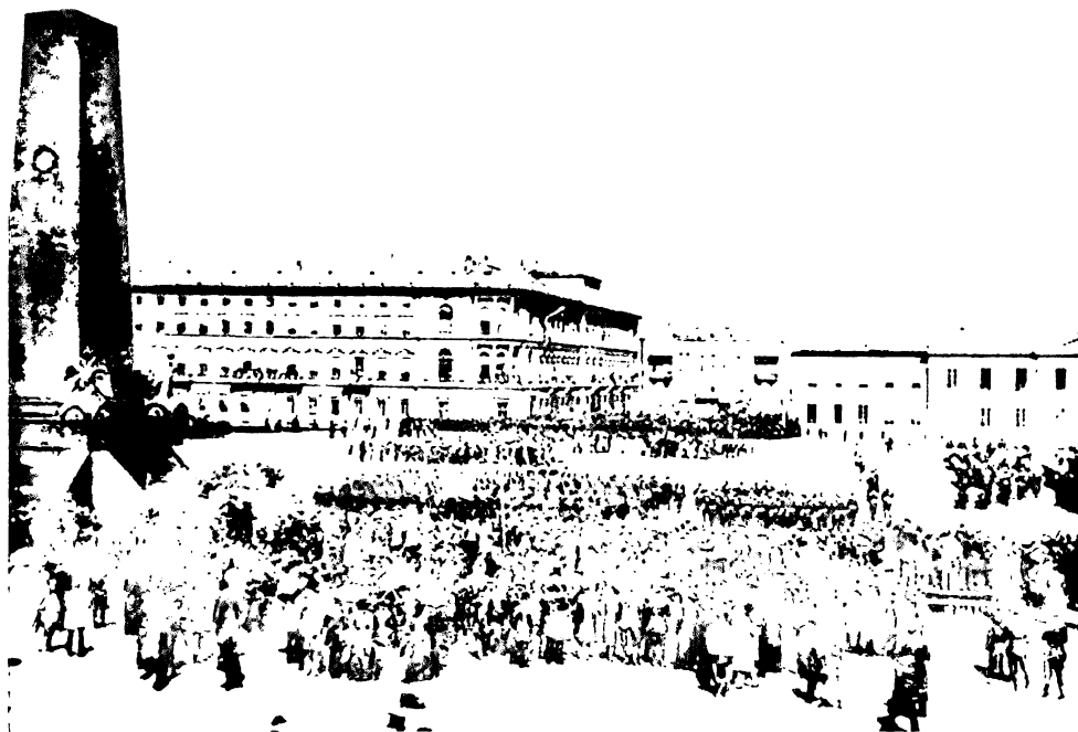
Помнік на Саксонскай плошчы «Палякам, палеглым у 1830 г. за вернасць праваму ўраду» (каля 1880 г.).

магіламі будучых кладаў былі брацкія магілы палеглых у штурме рэдута ў 1831 г. Касцёл святога Лаўрэна было вырашана перабудаваць на царкву Маці Божай Уладзімірскай, апыжункі дня, у які была захоплена Варшава. У памяць бітвы 26 жніўня (7 верасня) 1831 г. у сцены касцёла былі ўмураваны 12 расійскіх гарматных дулаў з ядрамі, а ўнутры быў павешаны вялізны памераў надсвечнік, зроблены з гарматак і ядраў, на сценах былі змешчаны шэсць прадоўжных медных табліцаў з інскрыпцыямі, якія ўвечнілі ход бітвы і прозвішчы расійскіх афіцэраў, якія вызначыліся ў ёй.