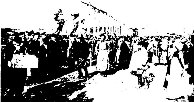
Злева: прадавец цыгар і цыгарэт падчас народнага гуляння на Макатоўскім полі (1892—1893 гг.).

Маскоўская прапаганда з дапамогай пушак ад запалак у нас не спыняецца, нягледзячы на ​​неаднаразовыя нашы напаміны. У многіх нашых тытунёвых