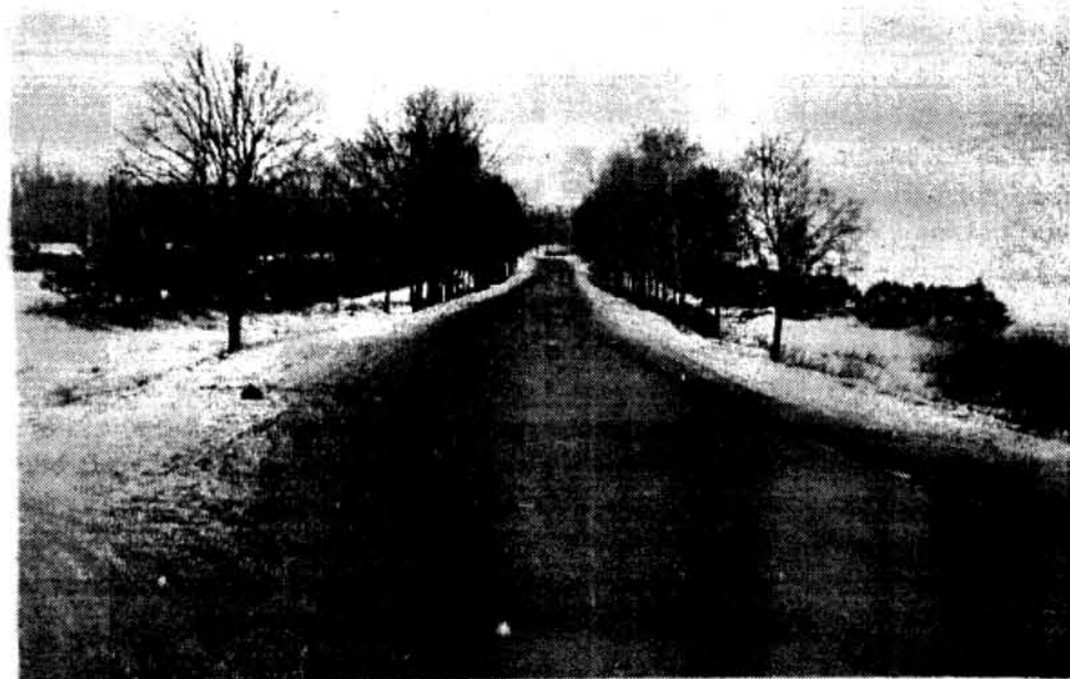
Мяжа. Уважліва сьледзіць колеру Apple Colors — гэтаму імгненню з’явіўся