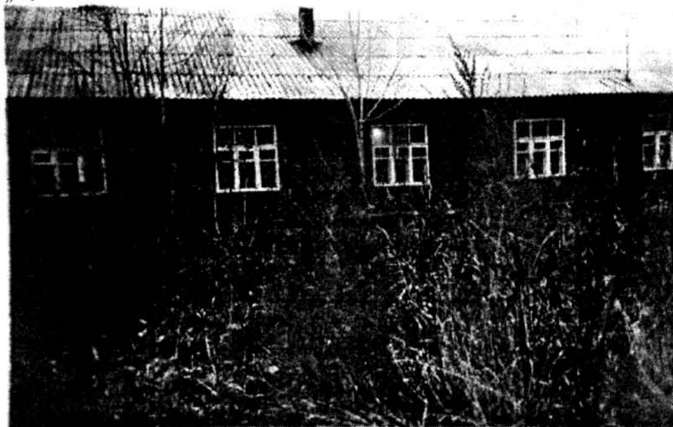
Працяг на старонцы 7.