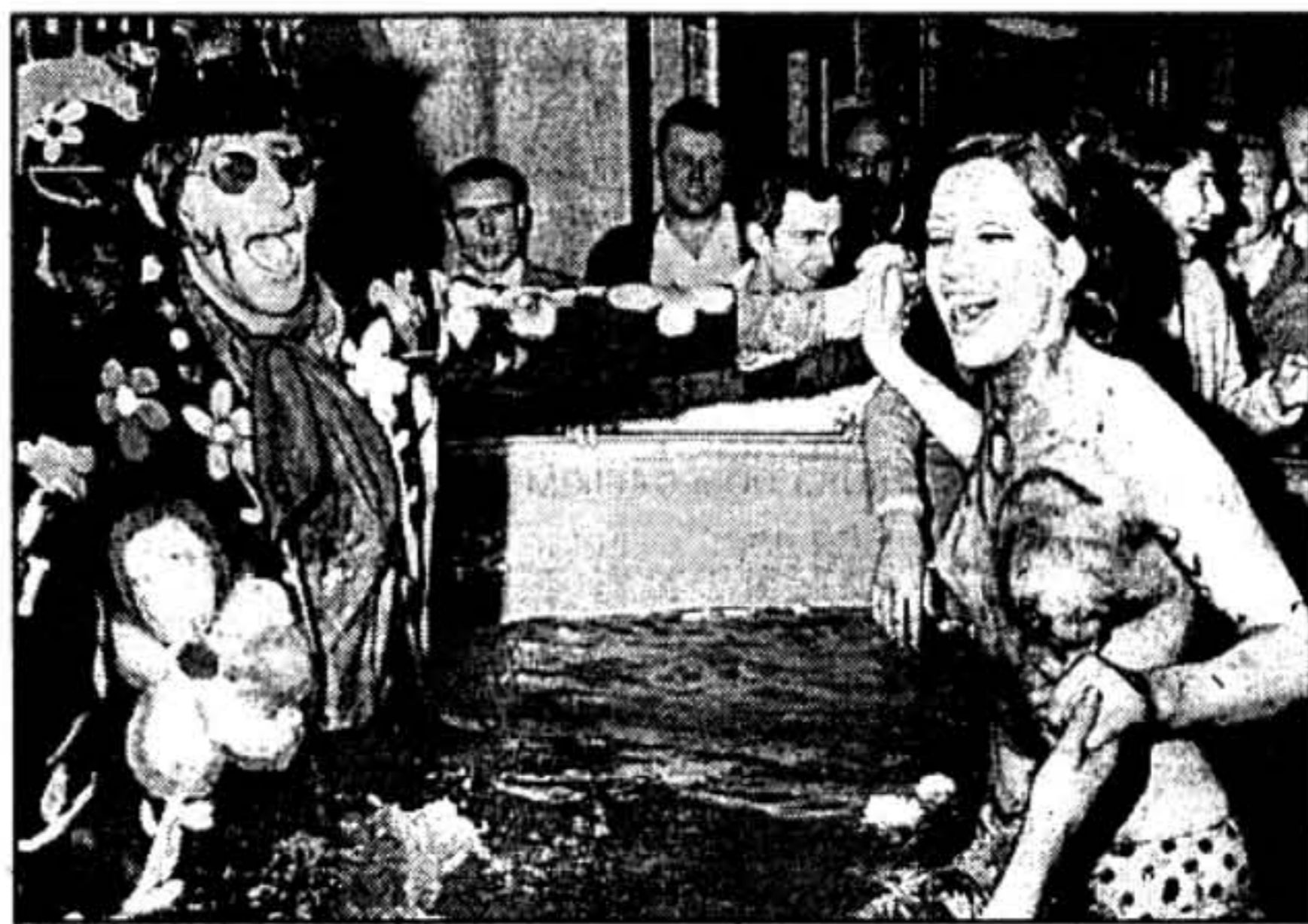
Акцыя хіпі (1967)

Нехта падхапіў дэкламацыю ў іншым куце, але ўжо больш для сябе самога, бо неўзаба-ве голас сьцішыўся і зусім змоўк, саступіўшы месца прамовам усіх да ўсіх і ні да кога. Вы-глядала, што сёньняшнія наведнікі выдатна ведаюць тэкст Бэроўза, які аб'ядноўвае іх, запрашае збірацца пад дахам "Сьвятога Марка". І тое, што для мяне сталася відовіш-чам, тэатрам, для іх — шараговая замова ў сваім бары. Можа, іншым вечарам яны ўго-