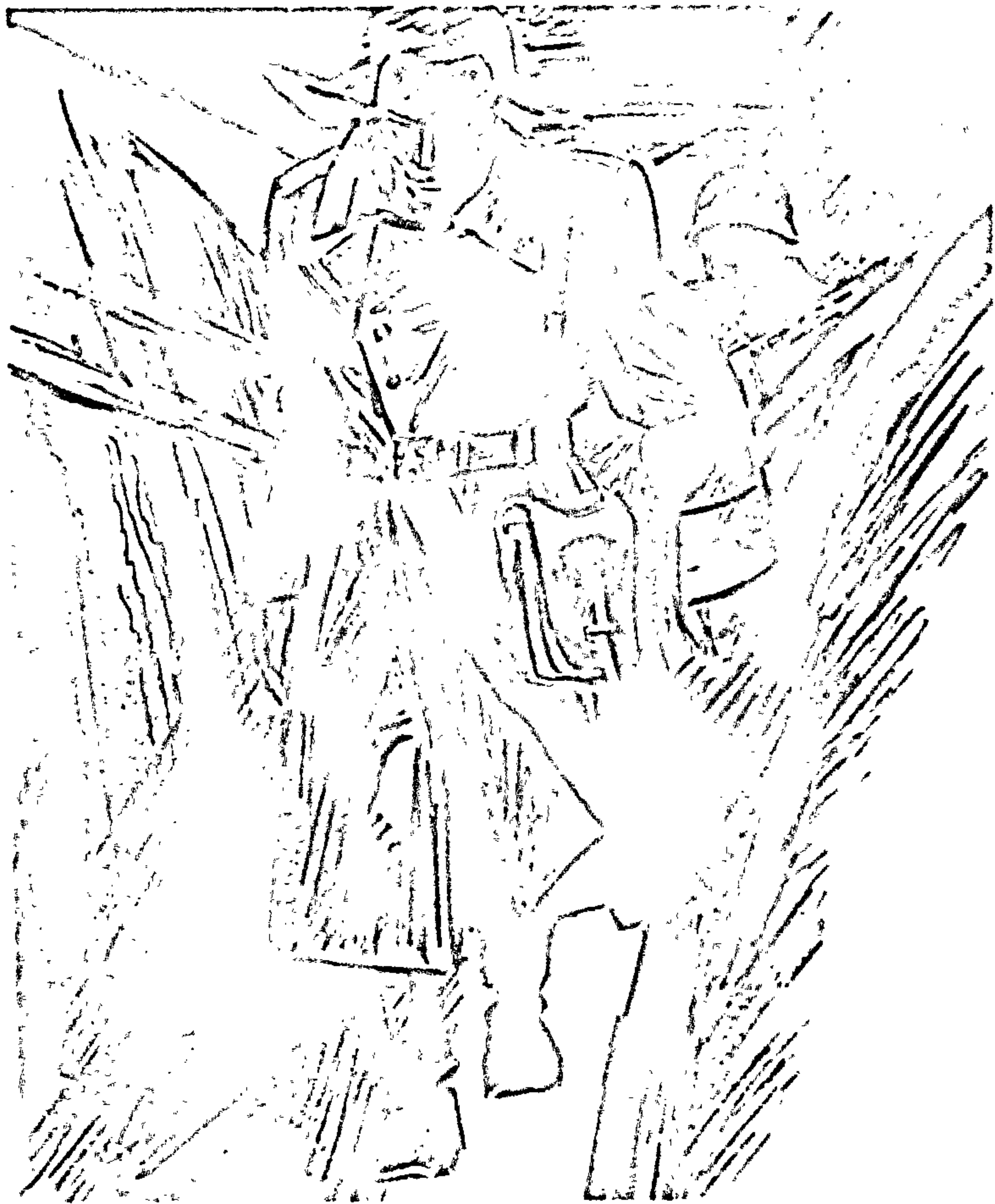
Да аповесці «Яго батальён» Мастак А. Кашкурэвіч