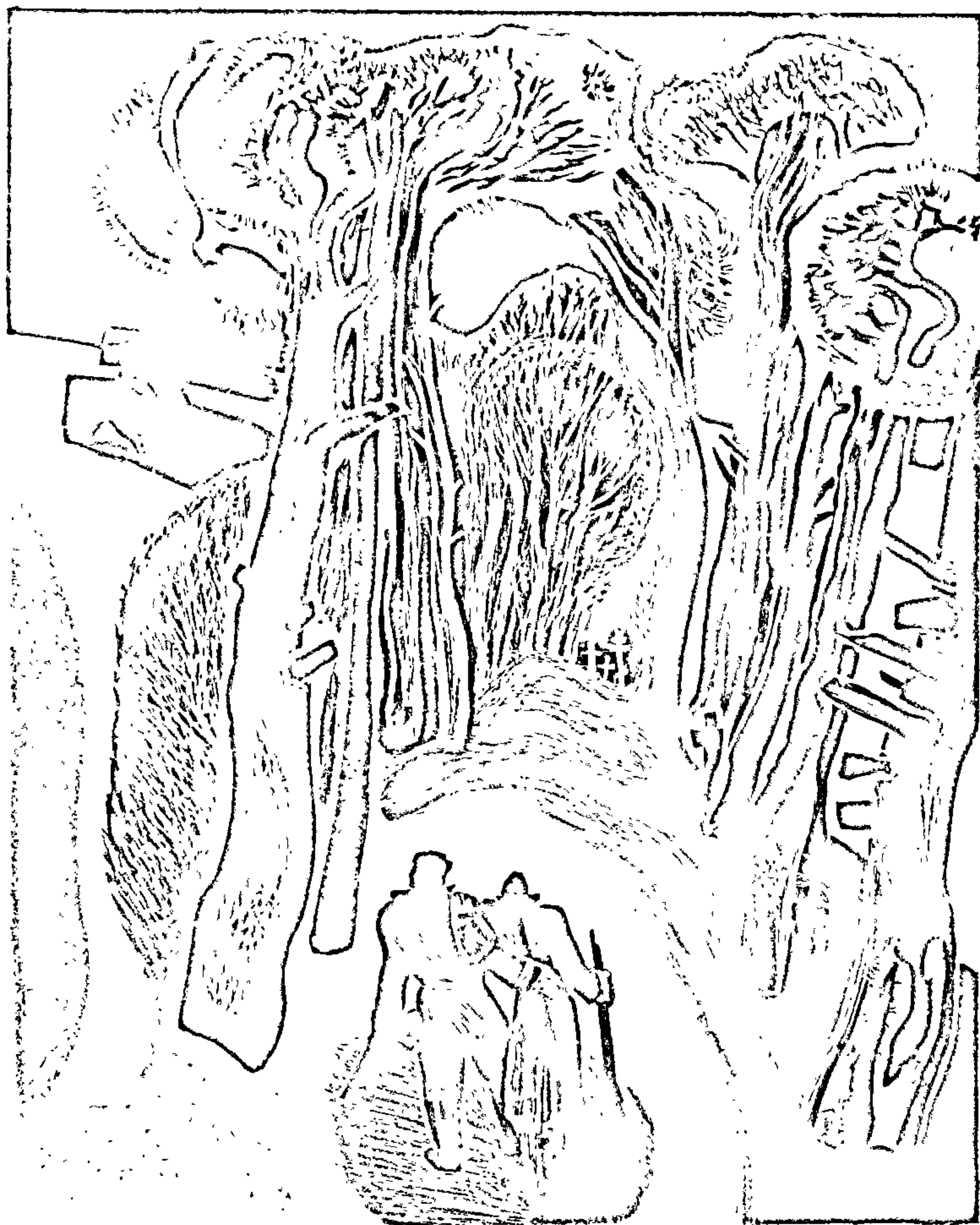
Да аповесці «Сотнікаў» Мастак Г. Паплаўскі