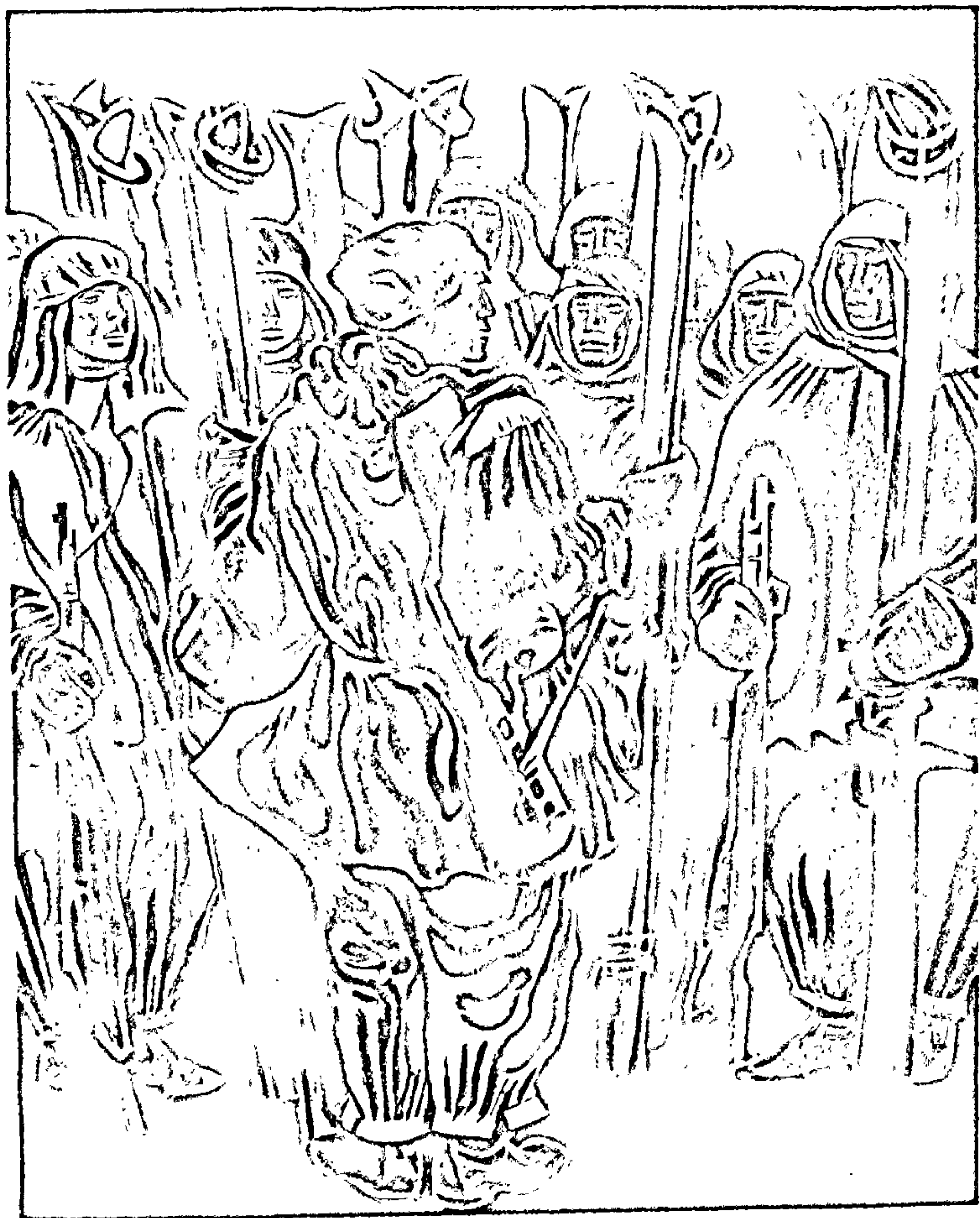
Да аповесці «Дажыць да світання» Мастак Г. Паплаўскі