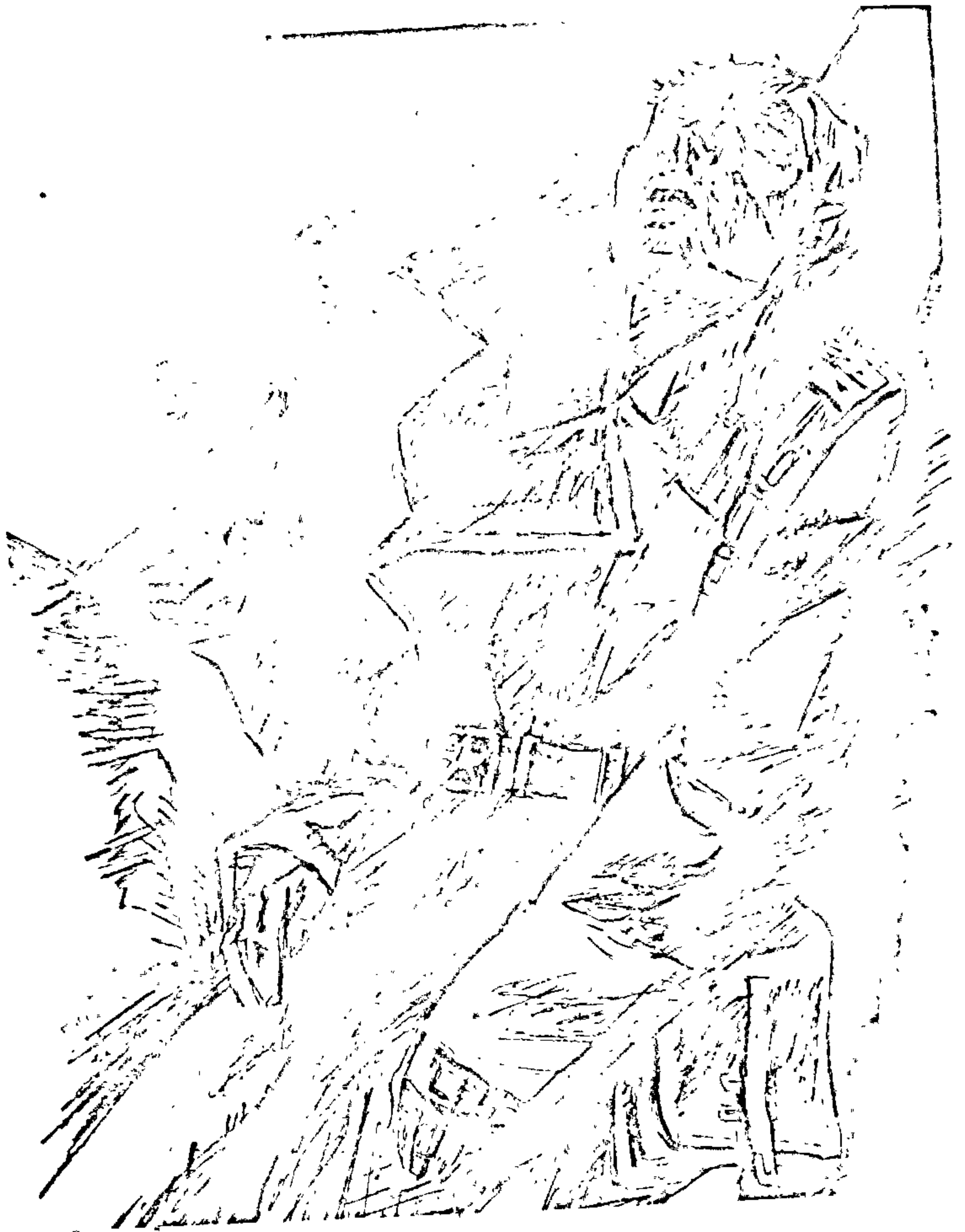
Да аповесці «Яго батальён» Мастак А. Кашкурэвіч