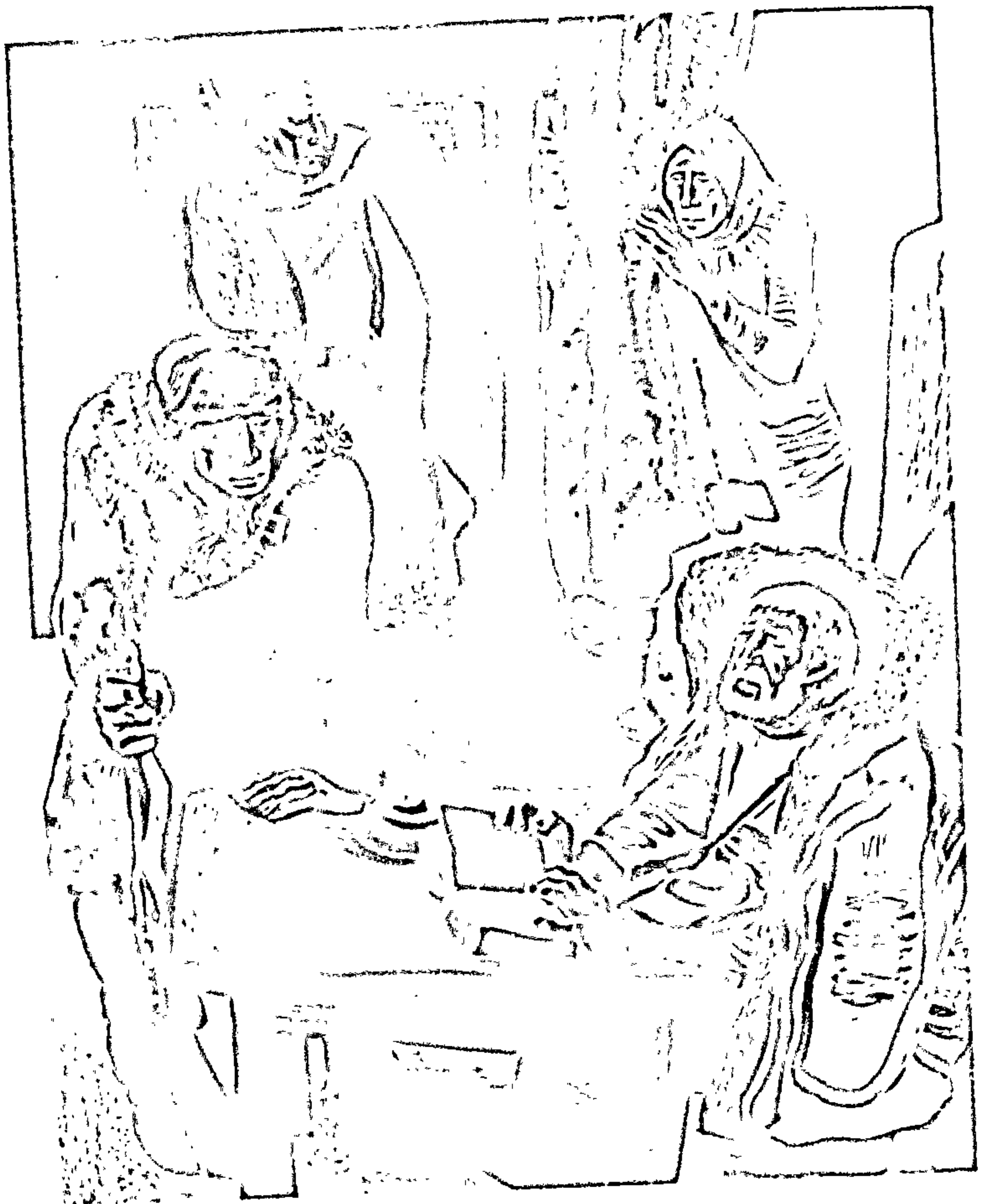
Да апавесці «Сотнікаў» Мастак Г. Паплаўскі