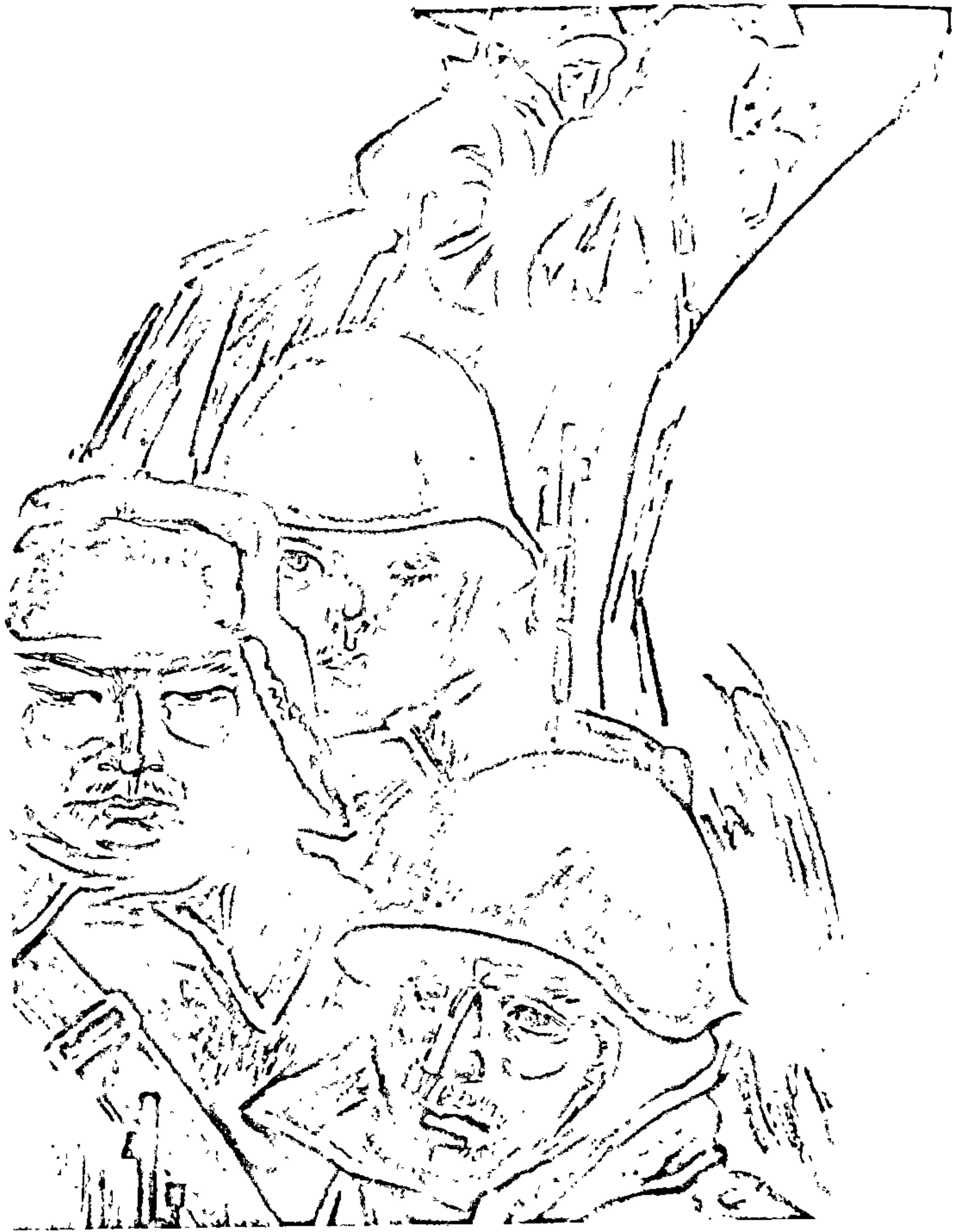
Да аповесці «Яго батальён» Мастак А. Кашкурэвіч