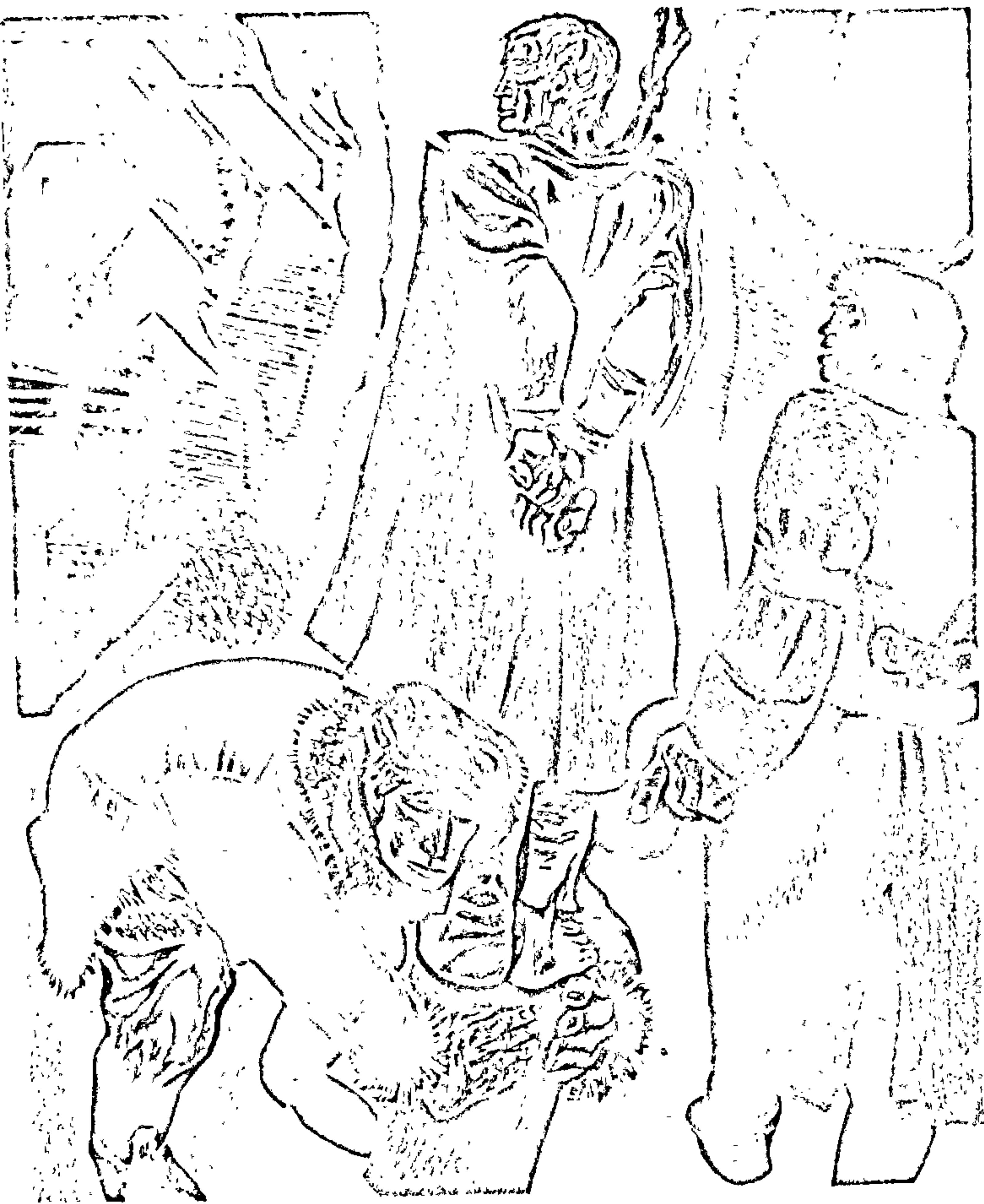
Да апавесці «Сотнікаў» Мастак Г. Паплаўскі