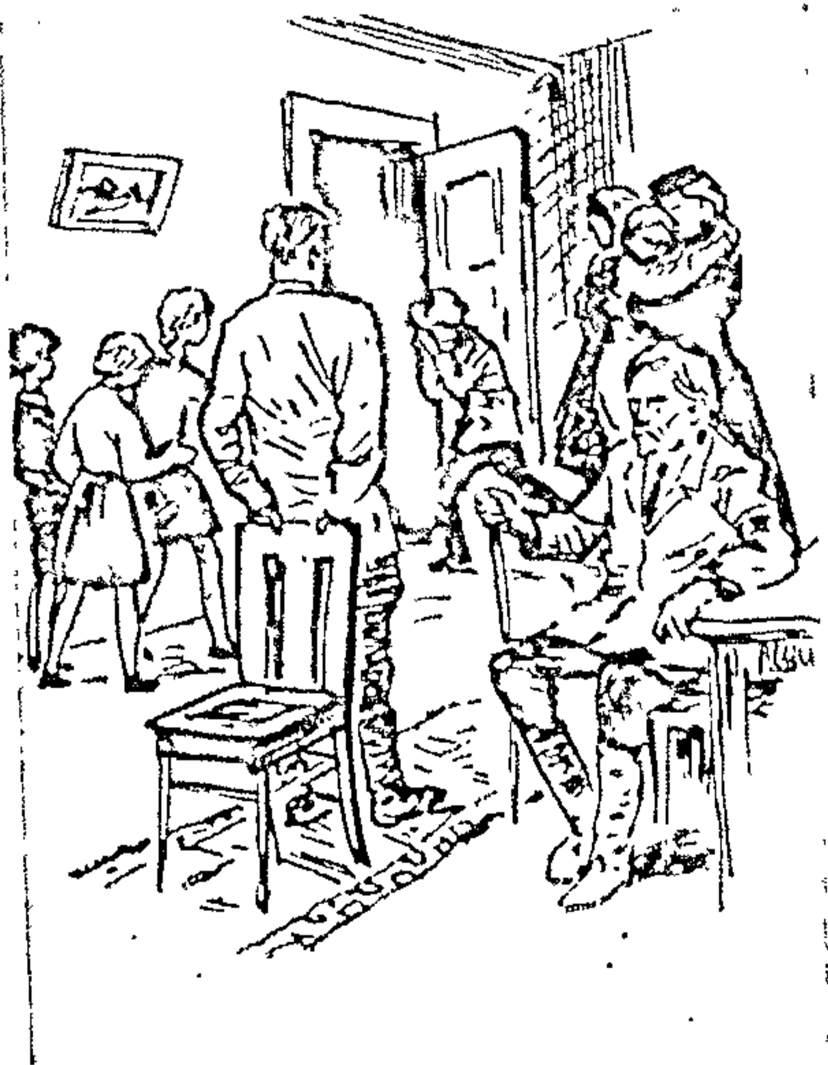
Ілюстрацыі да аповесці «Пасечка». Мастак Ю. Пучыскі.