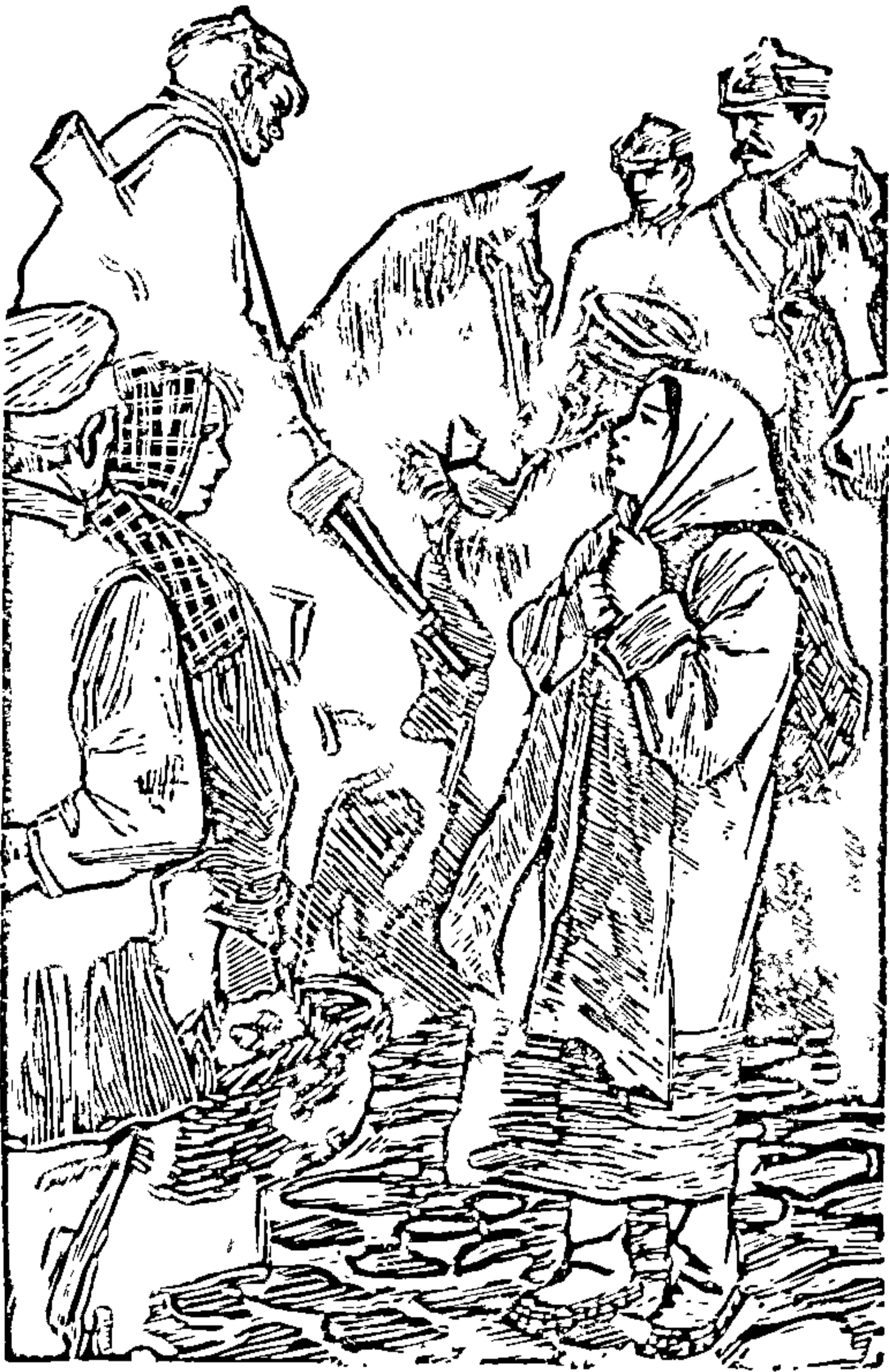
Ілюстрація да аповесці «Люба Лук'янская». Малюнак М. Гуцёва.