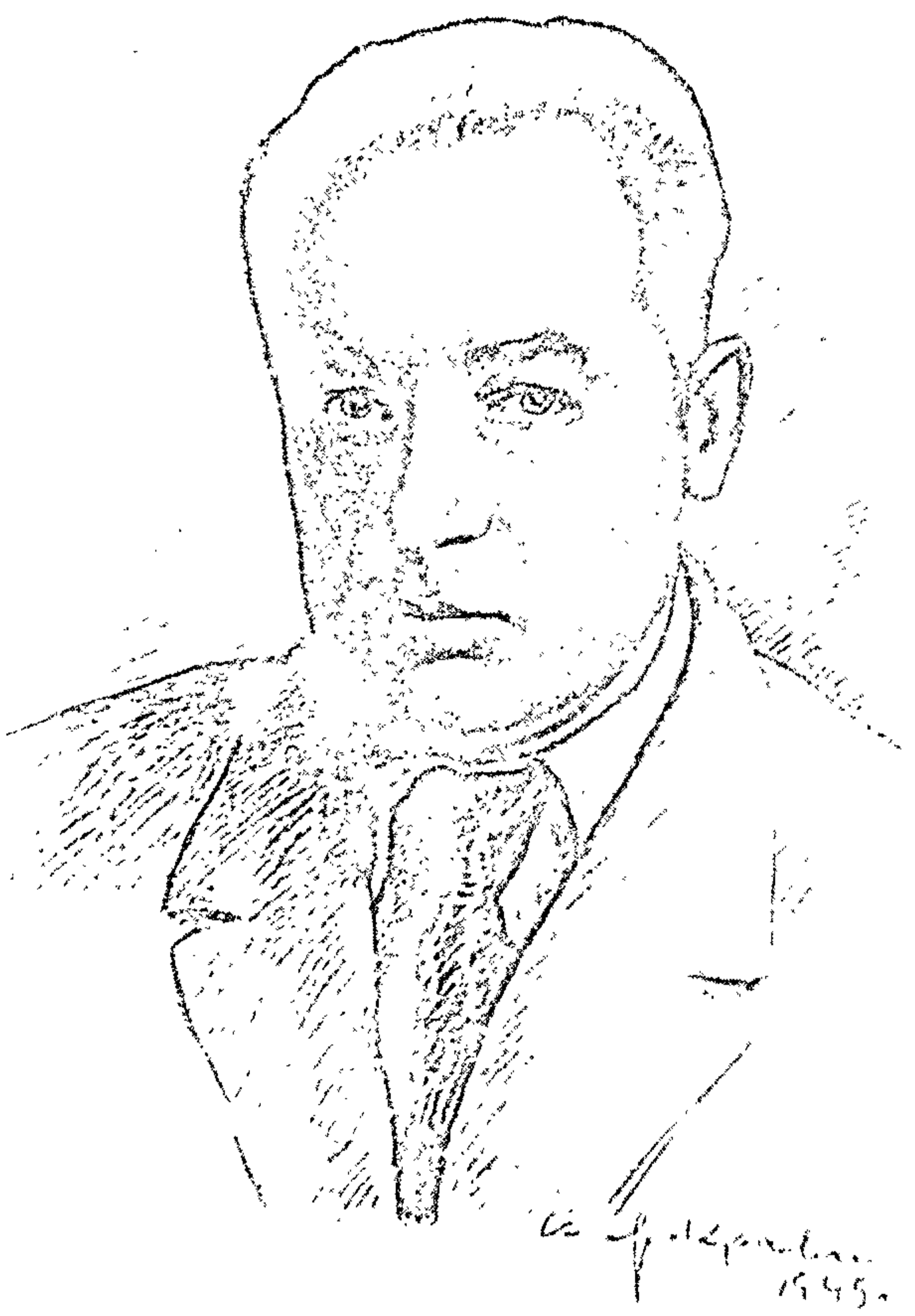
Кузьма Чорны. Мастак А. Яр-Краўчанка.