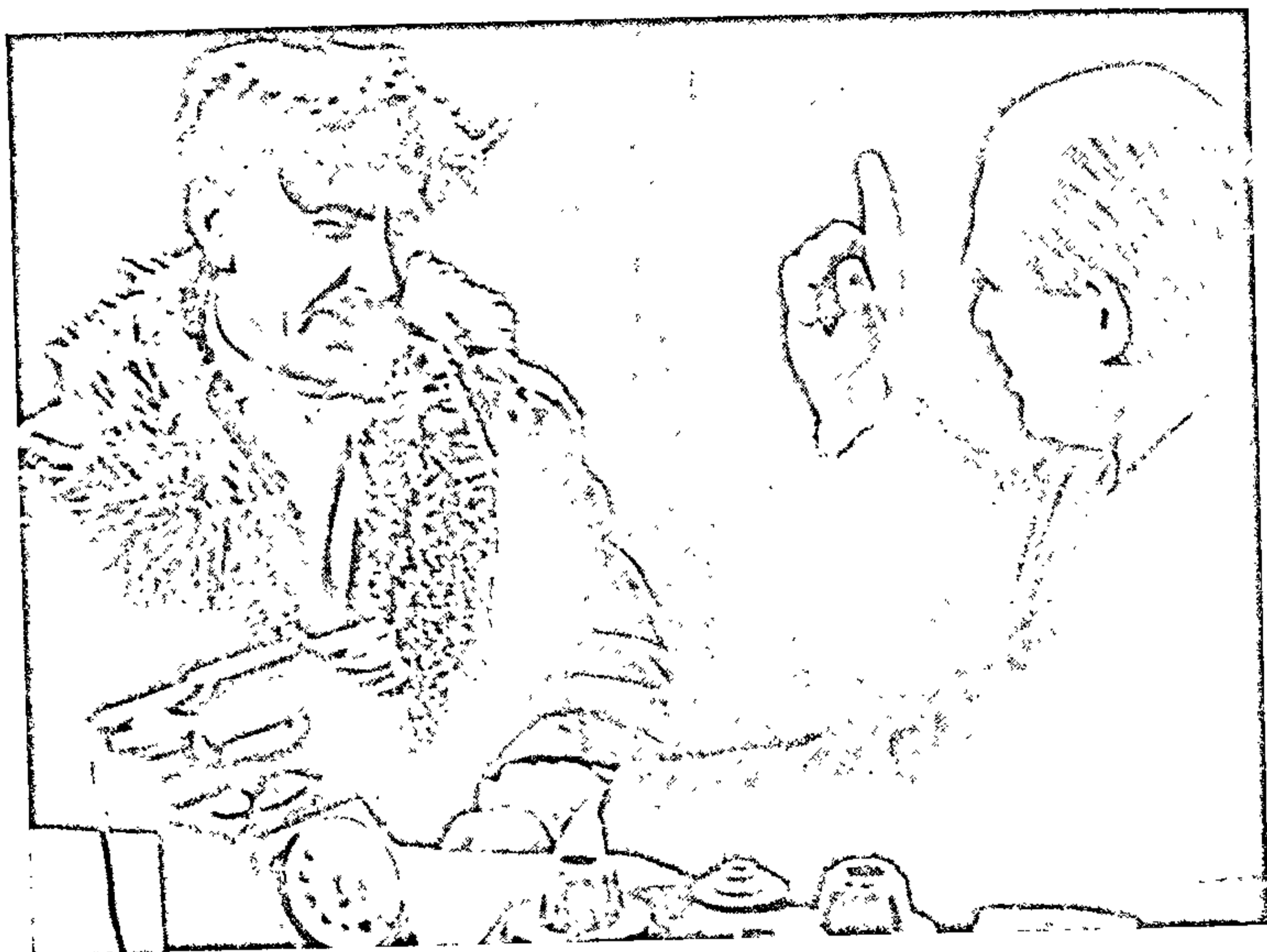
Сцэна з тэлеспектакля па раману «Трэцяе пакаленне».