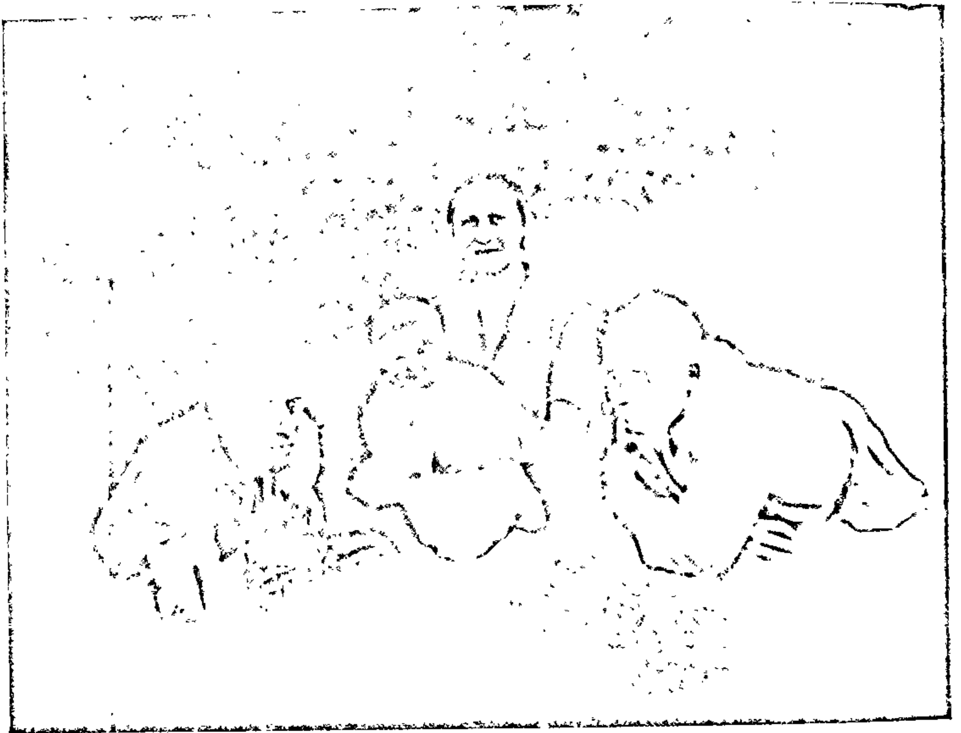
Кузьма Чорны (справа) з жонкаю Р. І. Свєраноўскай, дачкаю Рагнедай і шваграм Д. І. Свєраноўскім. 1929 г.