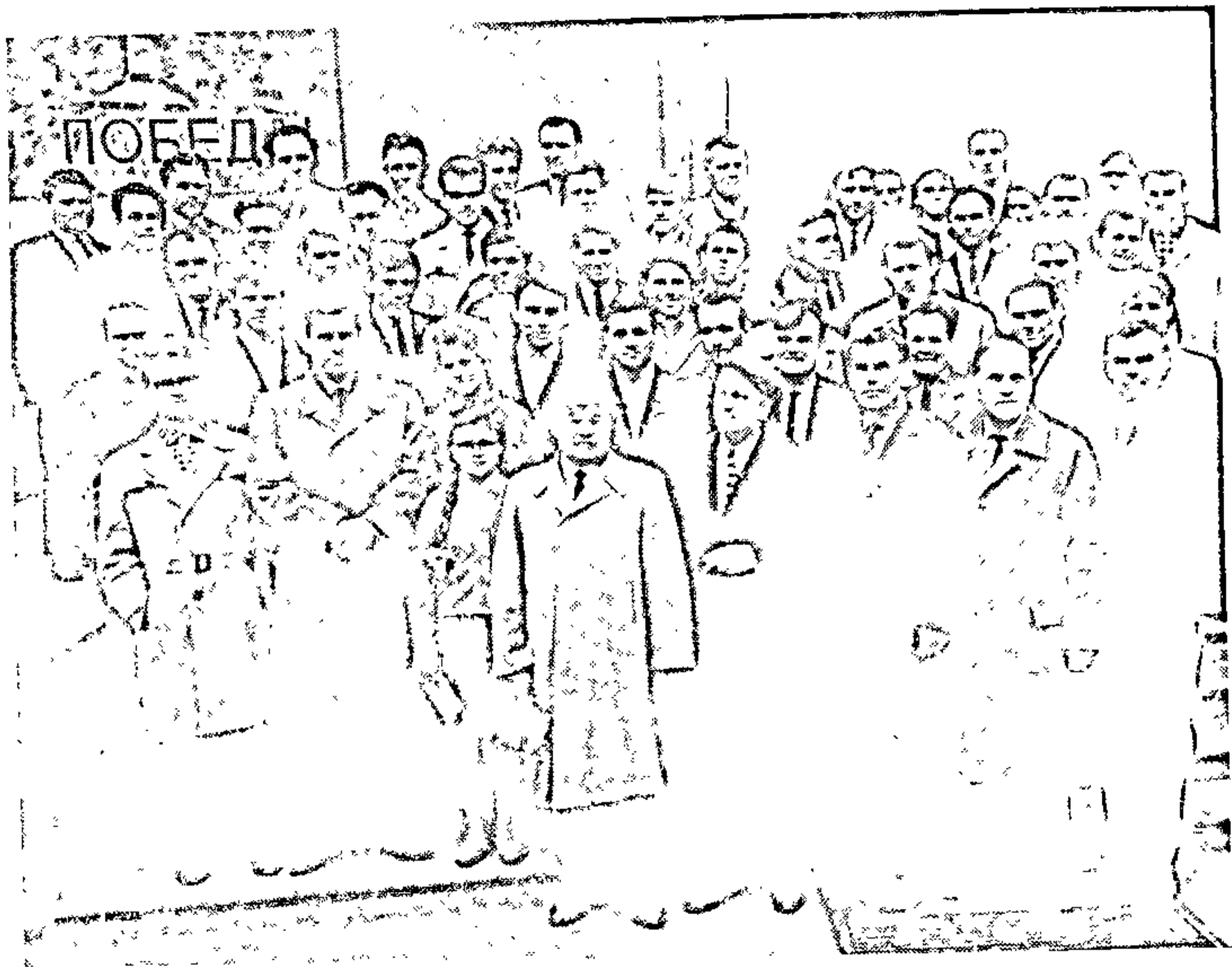
У час семінара пісьменнікаў Гродзенскай вобласці. Гродна, 1965 г.