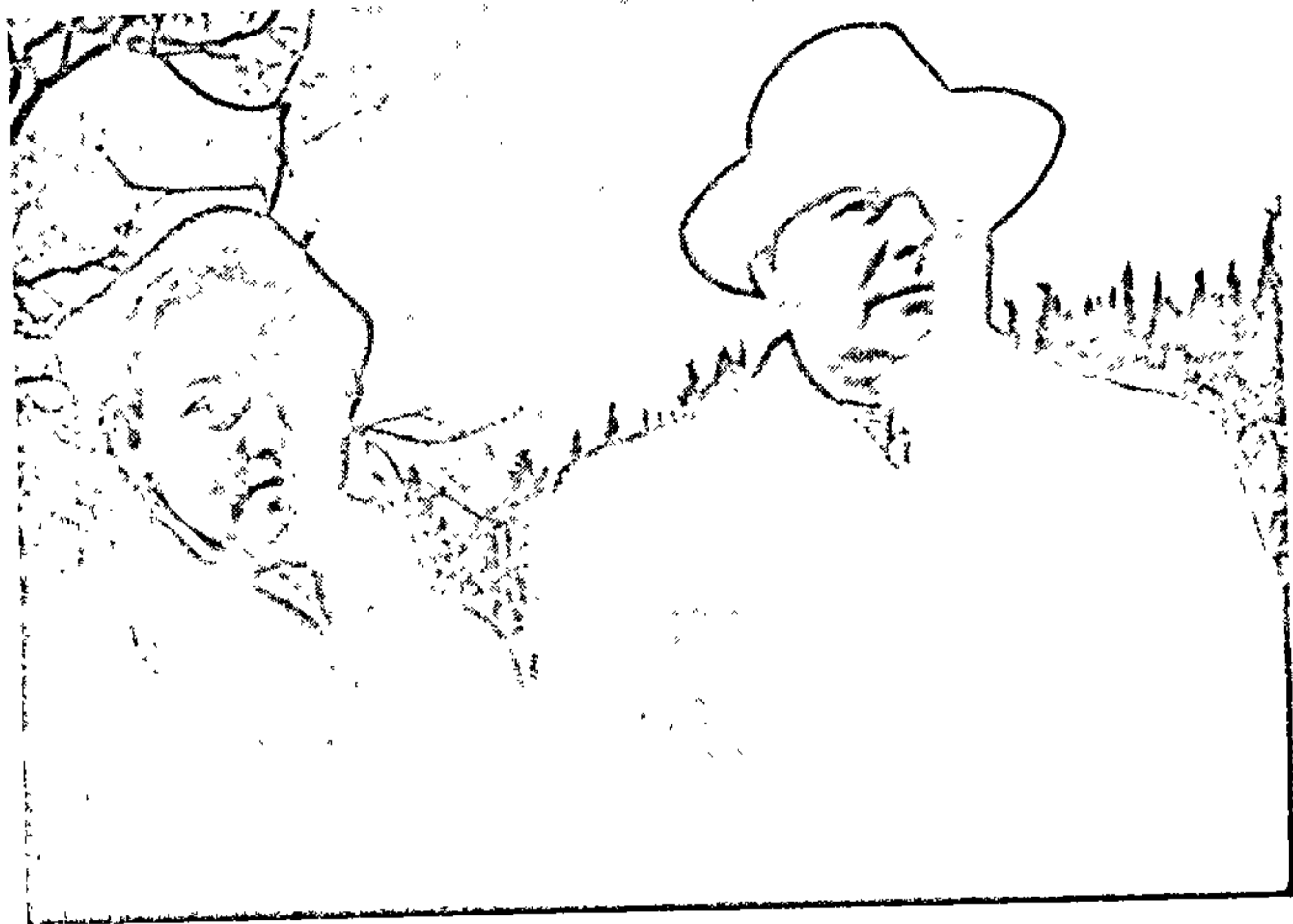
Піліп Пестрак і Лідзія Абухава. Ялта, 1959 г.