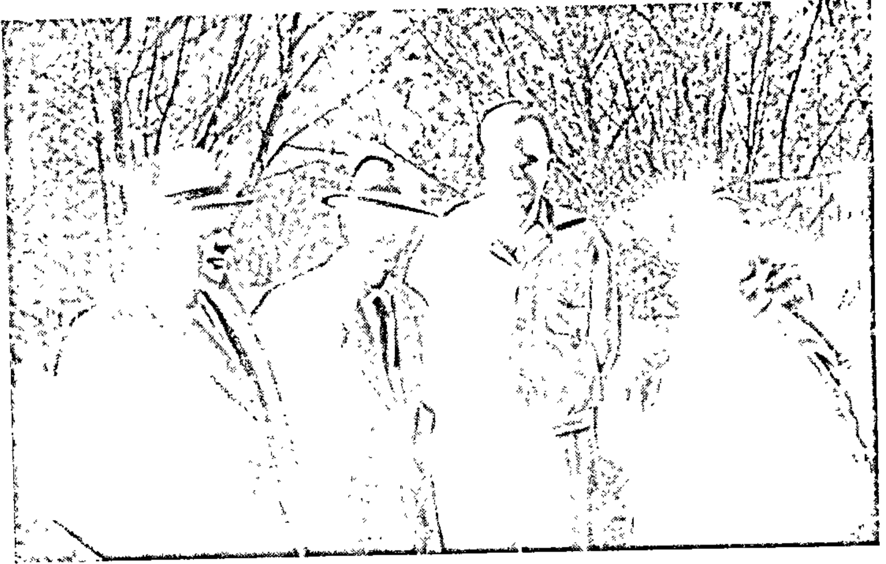
Піліп Пестрак сярод беларускіх пісьменнікаў. 1950 г.