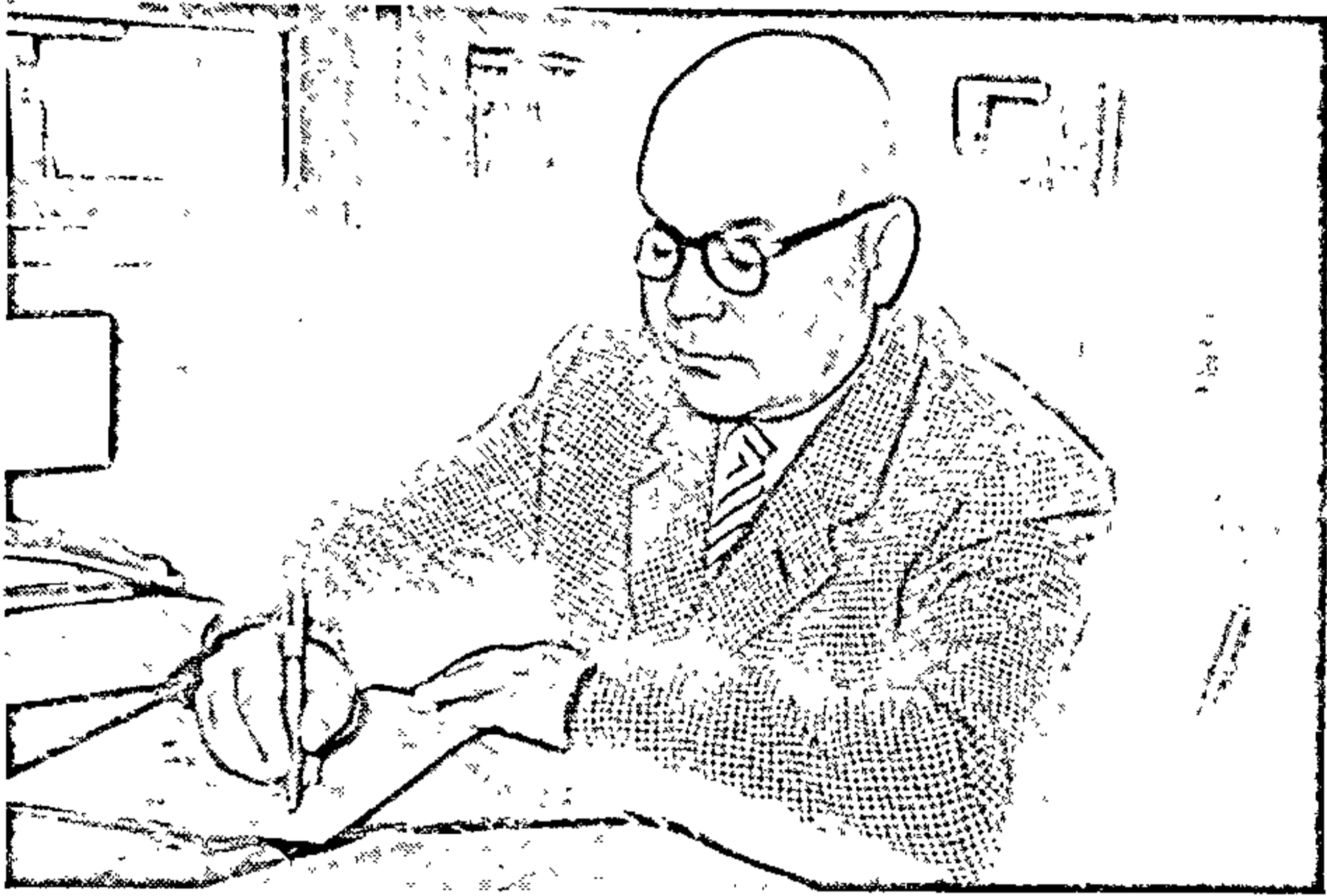
За работай у кабінце. 1959 г.