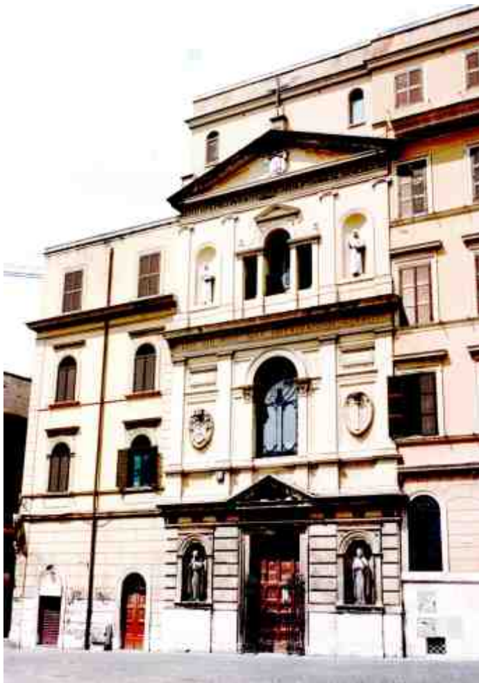
Рымскі храм сьвятых Сяргея і Вакха ў якім ўшаноўваецца старажытная Ікона Маці Божай Жыровіцкай (якую італьянцы называюць Madonna del Pascolo ).