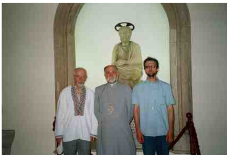
Ля Свѣтога Пятра...