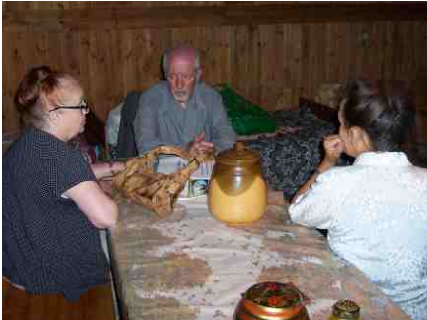
У Вушачы ў матчынай хаце...