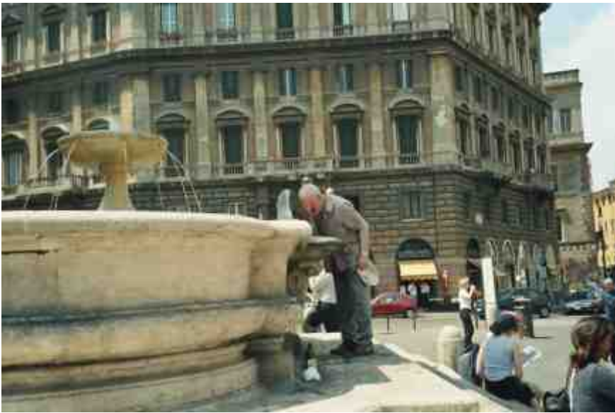
У Вечным Городзе...