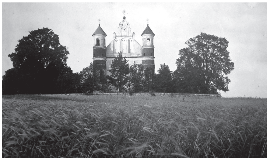
Маламажэйкаўская царква ў 1920-х гг.