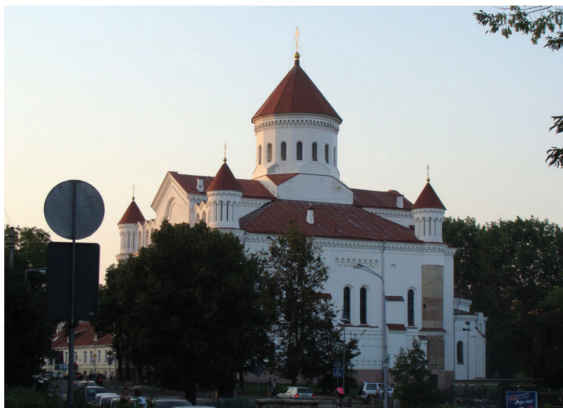
Прачысценскі сабор у Вільні. 2013 г.