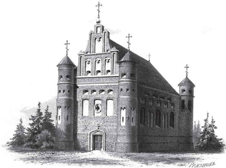
Маламажэйкаўская царква да перабудовы 1871–72 гг., Малюнак Васіля Гразнова

вую паперу для кантрактаў і іншыя выдаткі. Падчас папраўкі царквы шмат чаго неабходнага было зроблена звыш сумы і, нягледзячы на гэта, камітэт не выйшаў з грошай, асігнаных урадам.