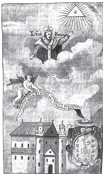
Свята-Мікалаеўская царква абарончага тыпу ў Берасці, існавала ў XIV-XIX стст.