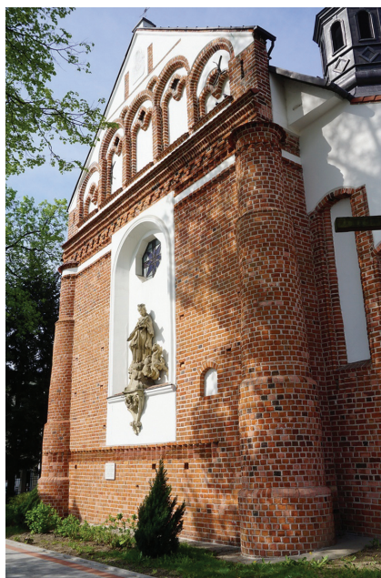
Касцёл Св. Ганны ў Пясочным, Польшча