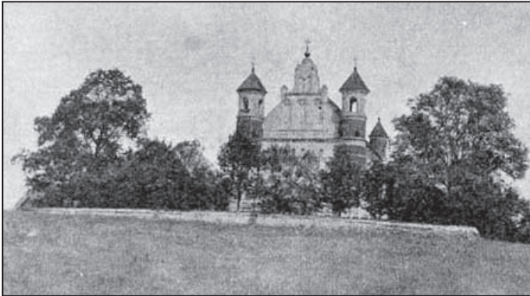
KOŚCIÓŁ W SKRZYBOWCACH – ZABYTEK XVI W.