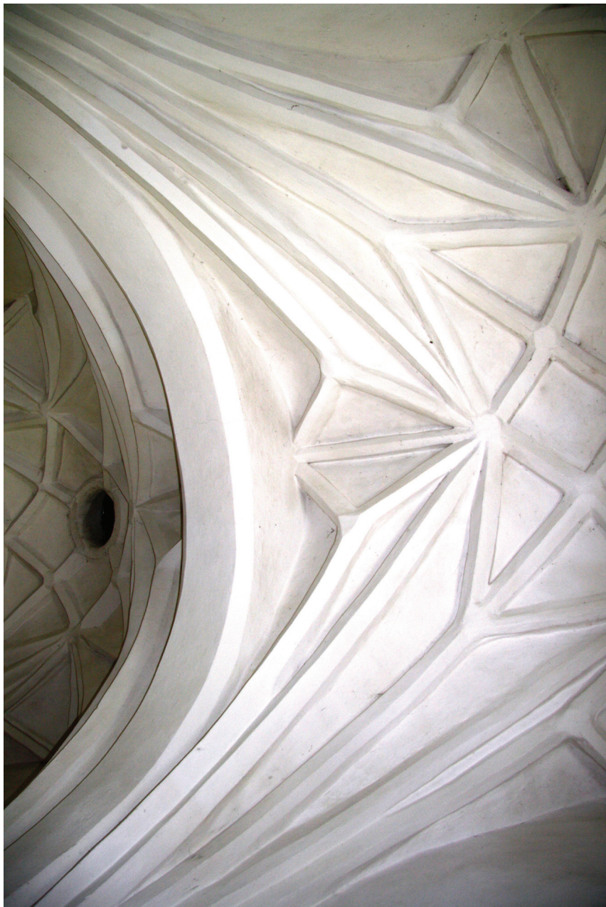
Тамычыныя зводы царквы, 2013 г.