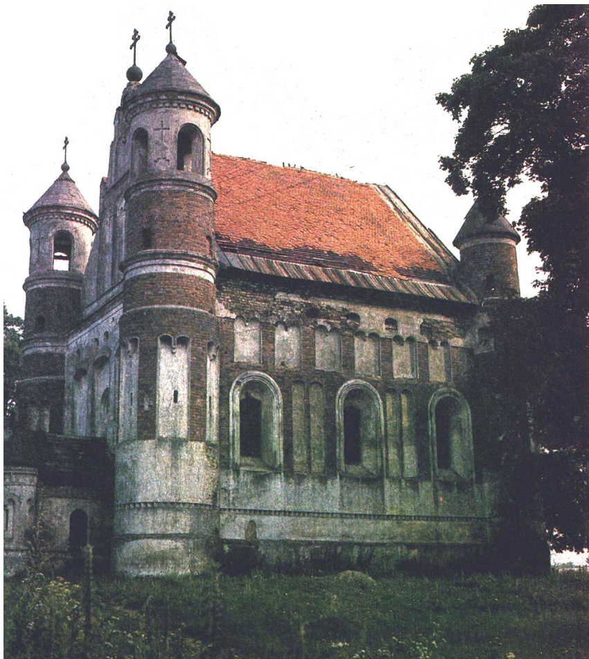
Царква пры канцы 1980-х гг. з Латарынгскімі крыжамі

Маламажэйкаўскі прыход мае 7 вёсак. На Вялікдзень, Каляды і прастольнае свята Нараджэння Прасвятой Багародзіцы адбываюцца хросныя хады. У 1999 г. царкоўны прышт складаўся са святара Віктара Свянціцкага і псаломшчыка-рэгента, дзейнічала нядзельная школа, у якой святар і яго матушка навучалі 15 дзетак 207 .