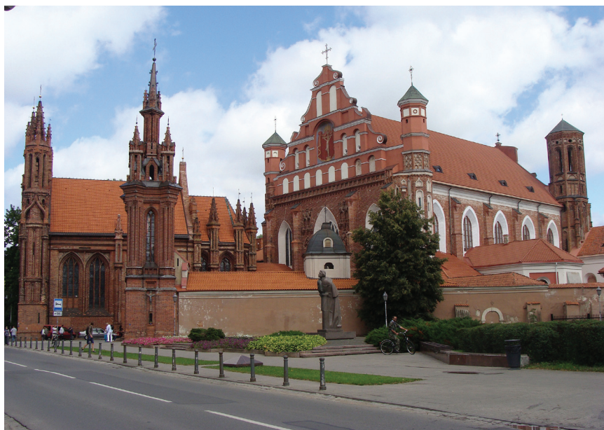
Касцёлы Бернардынаў і Св. Ганны ў Вільні.