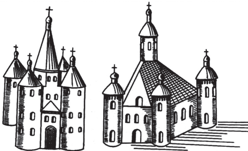
Сафійскі сабор ў Полацку, з малюнкаў XVI-XVIII ст. (паводле М. Ткачова)