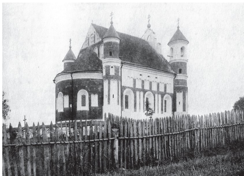
Маламажсэйкаļўская царква на пачатку XX ст.