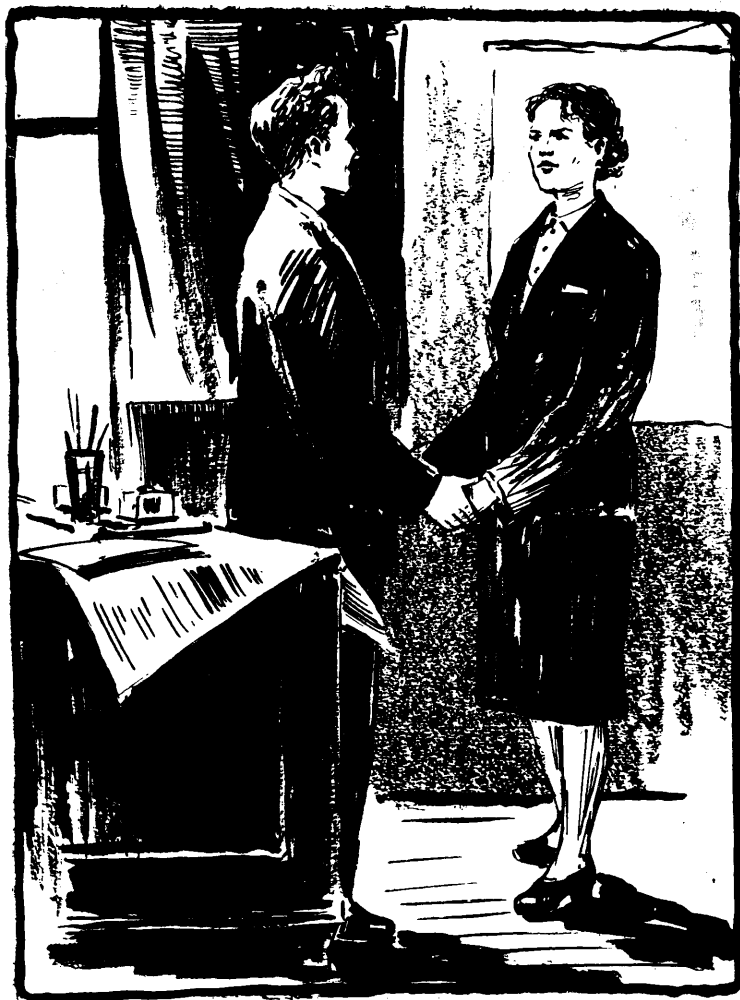
Мал. У. Лося.