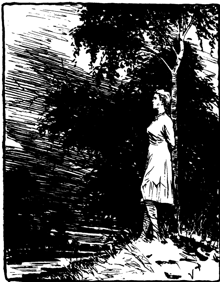
Мал. У. Лося.