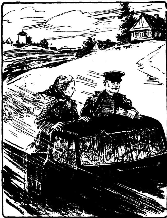
Мал. У. Лося.