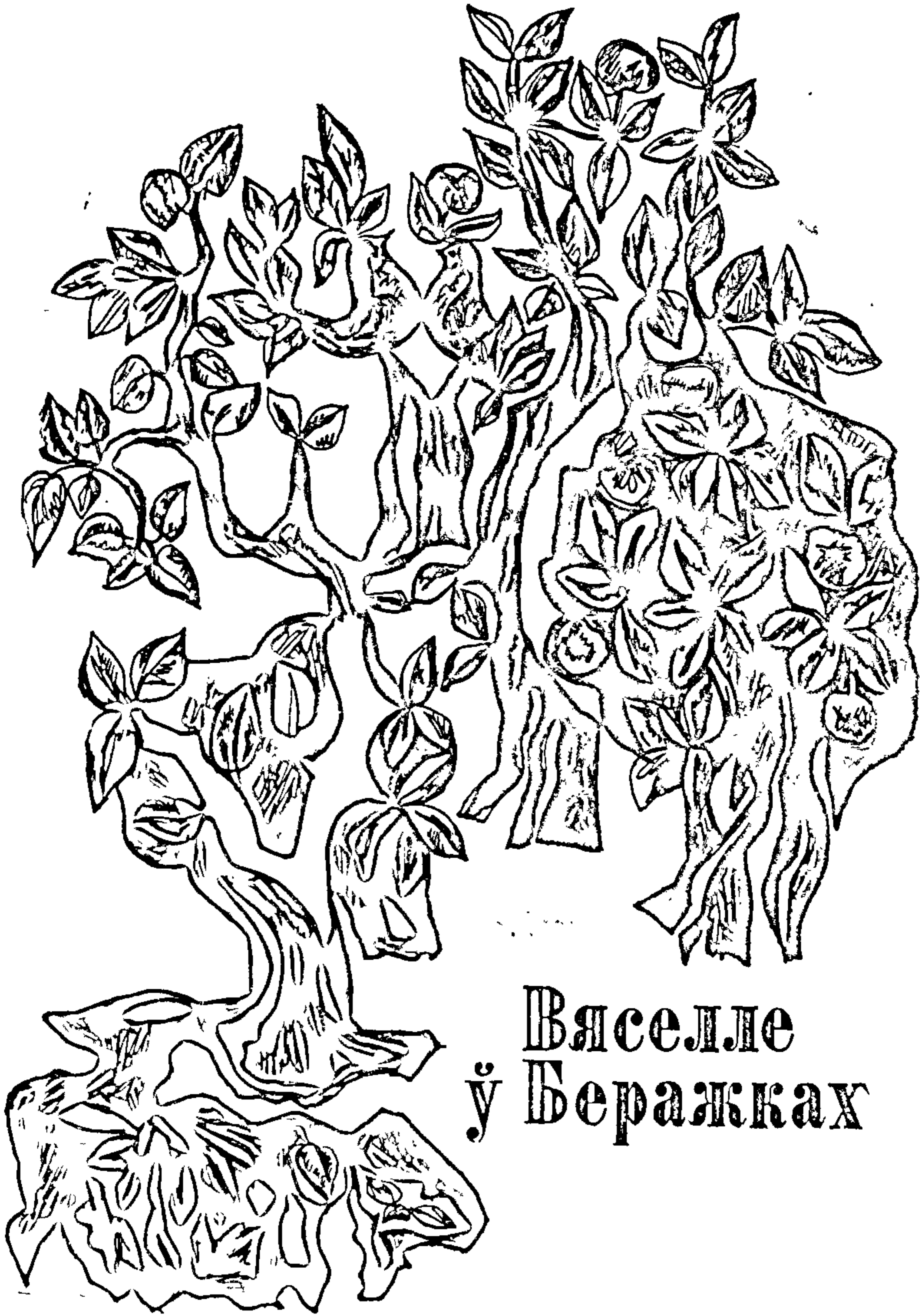
Вяселле ў Беражках