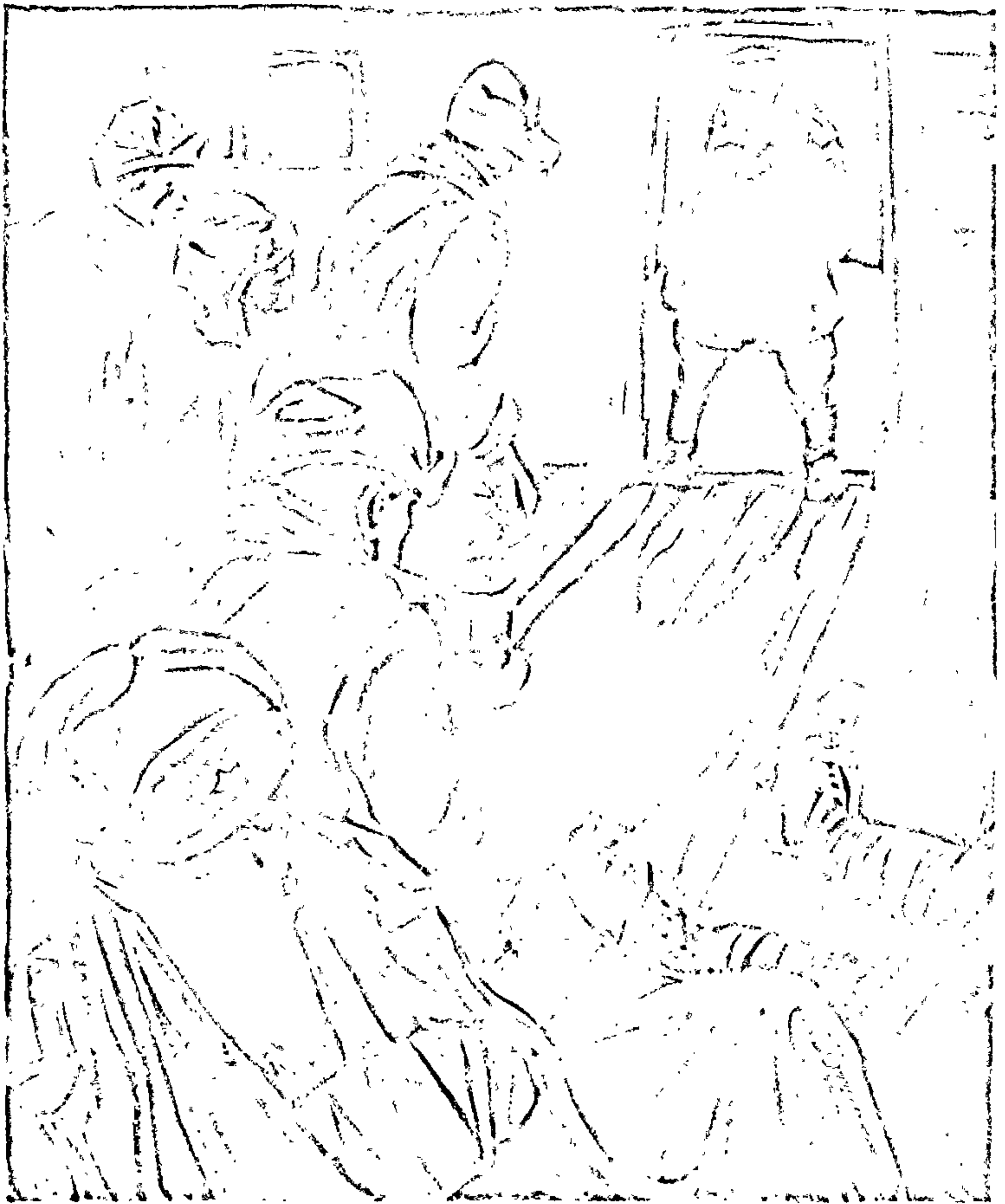
Да аповесці «Мёртвым не баліць» Мастак Я. Ігнацьеў