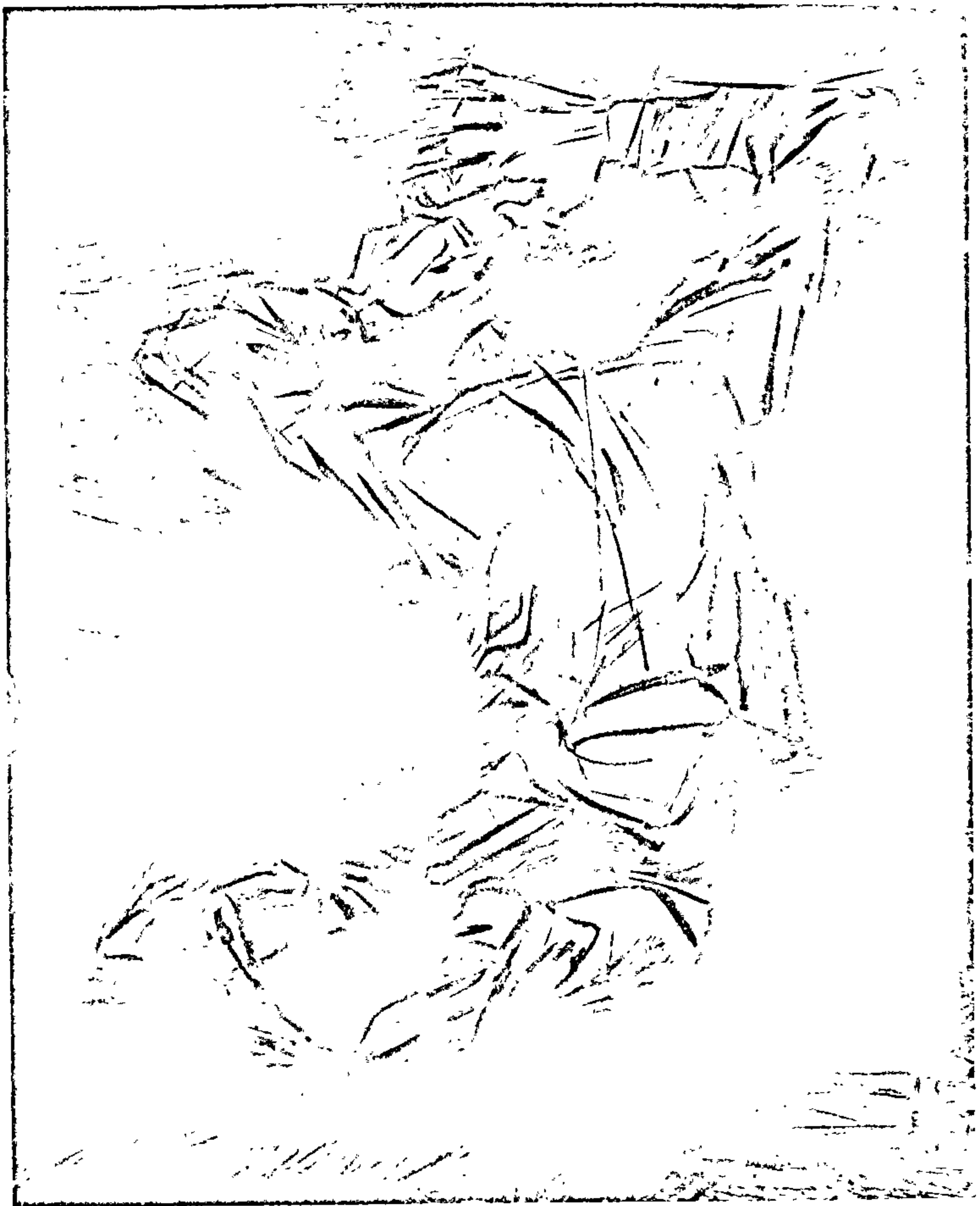
Да аповесці «Пастка» Мастак Ю. Герасіменка