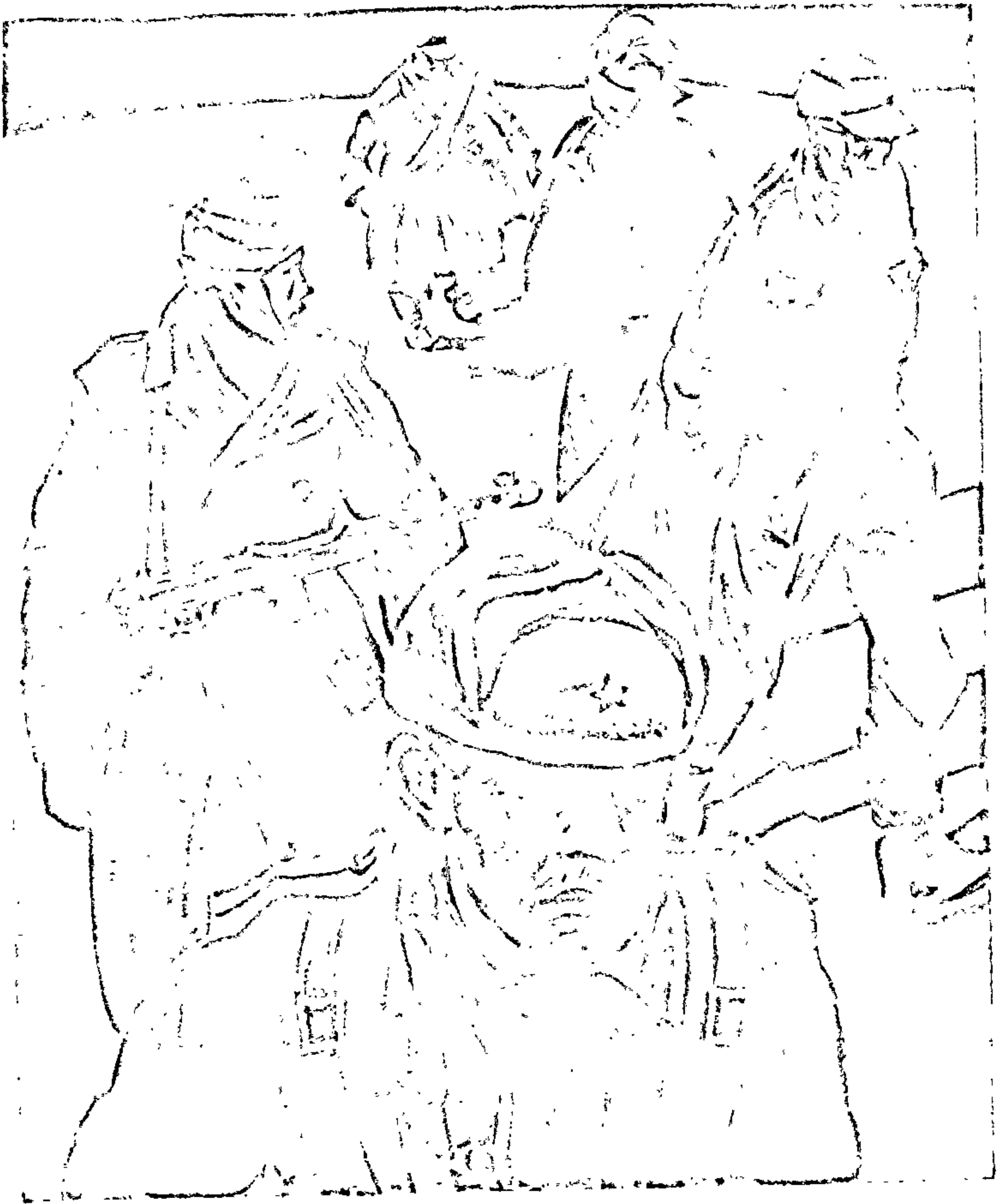
Да аповесці «Мёртвым не баліць» Мастак Я. Ігнацьеў