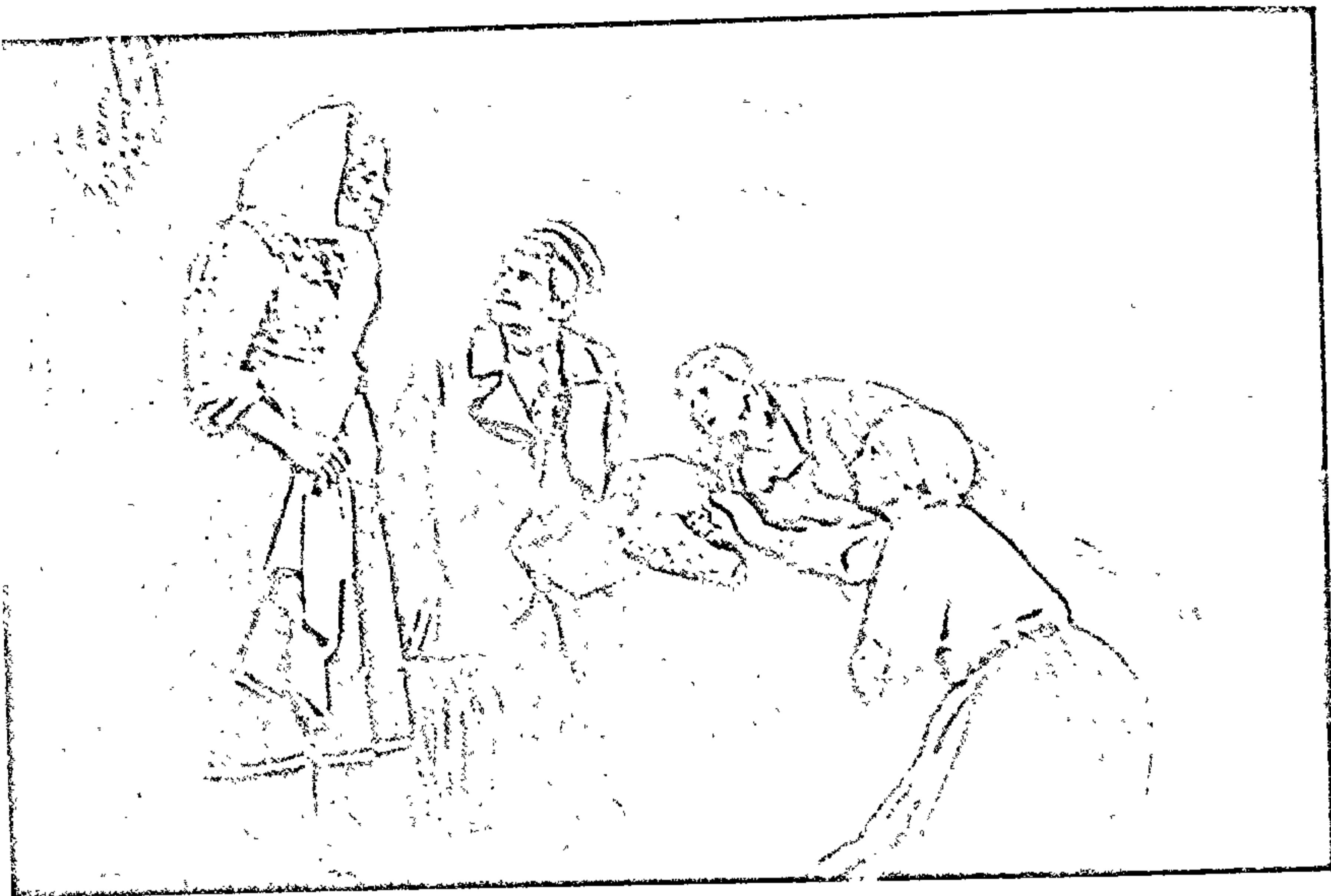
Сцэна са спектакля «Ірышка».