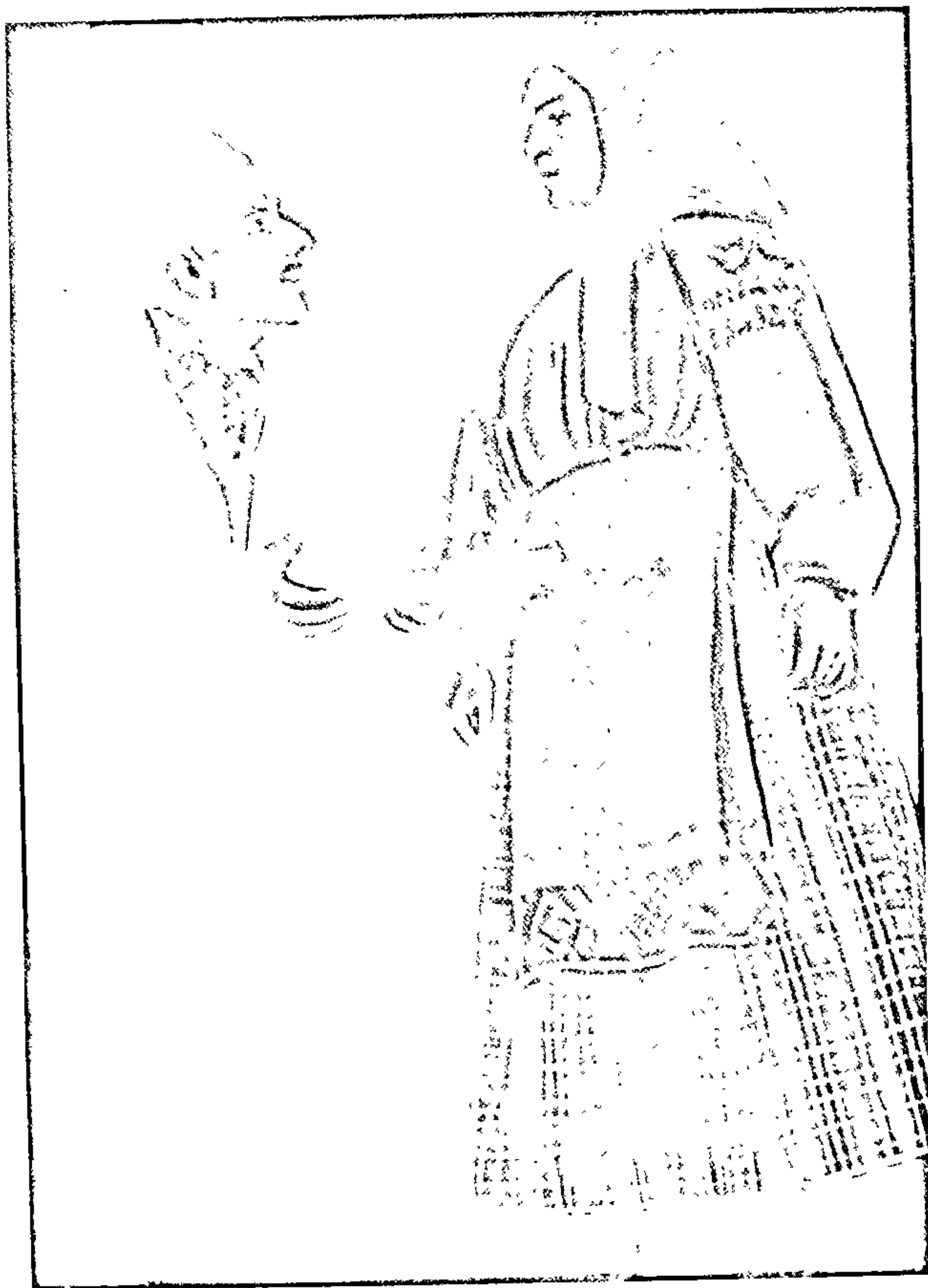
Сцэна са спектакля «Бацькаўшчына».