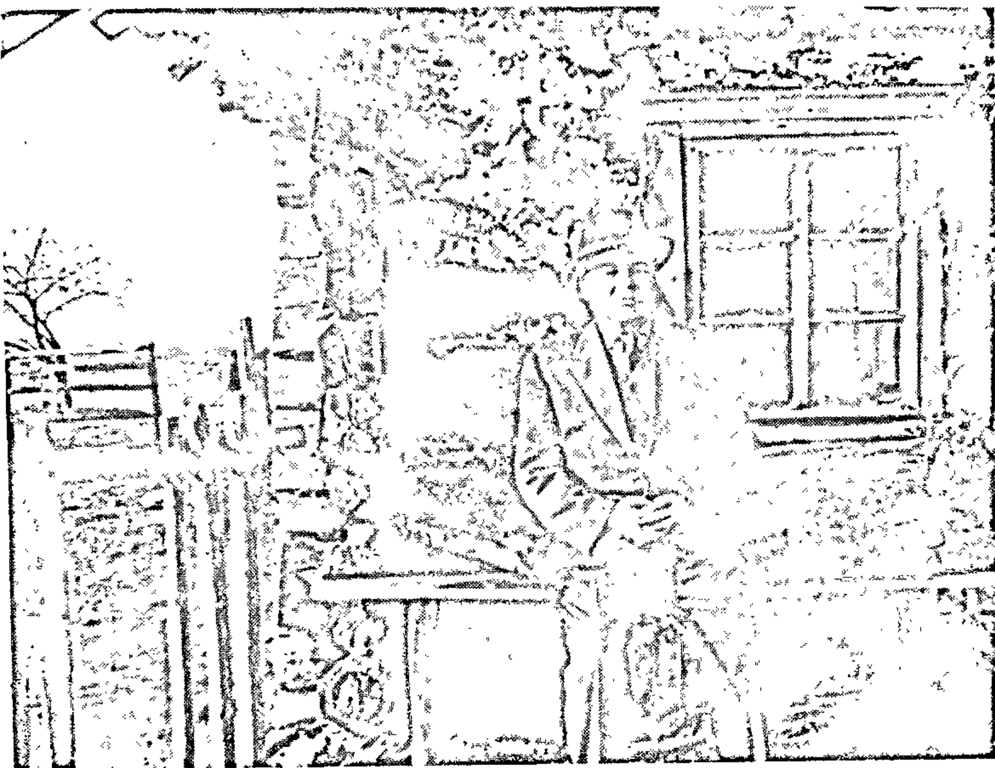
Піліп Пестрак ля сваёй хаты ў вёсцы Сакаўцы, 1962 г.