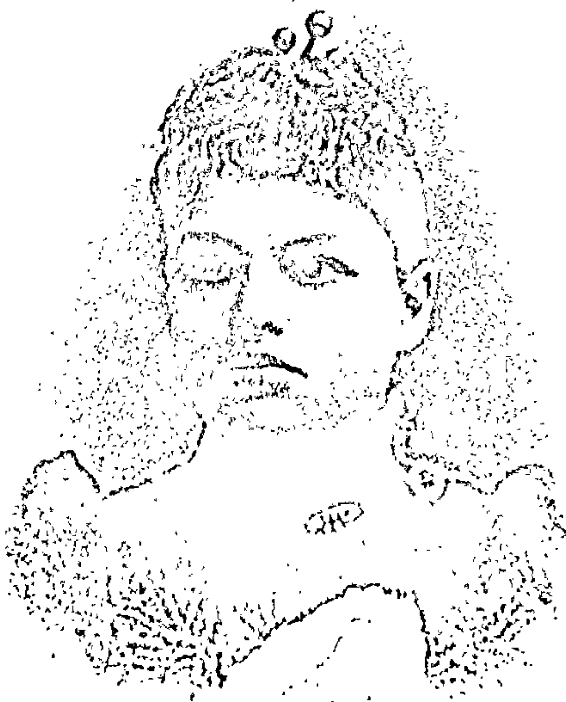
Да замалёўкі «Мой Ядвігін Ш.» Луцыя Гнатоўская