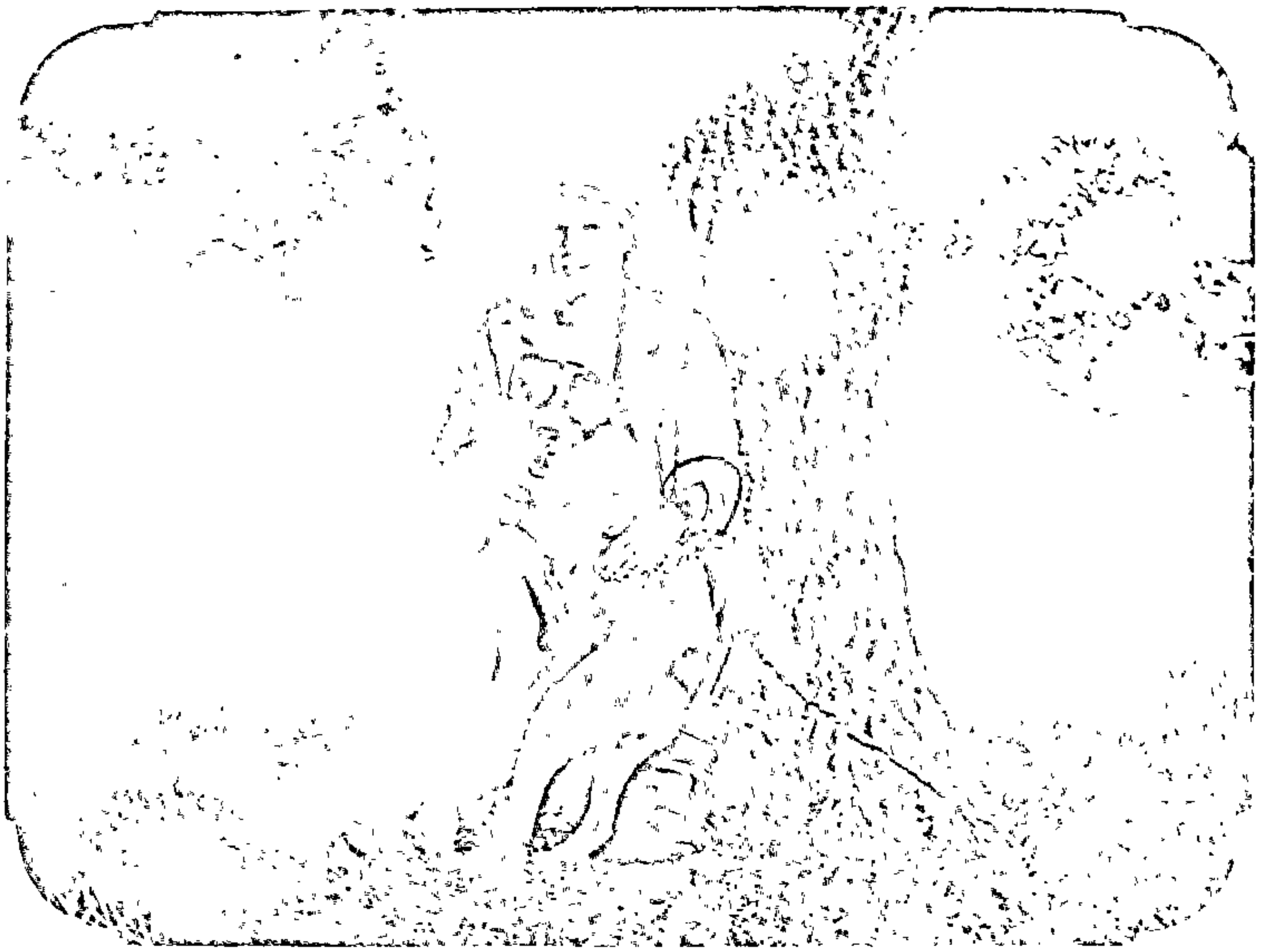
Да замалёўкі «Акопы» Купалаў дуб