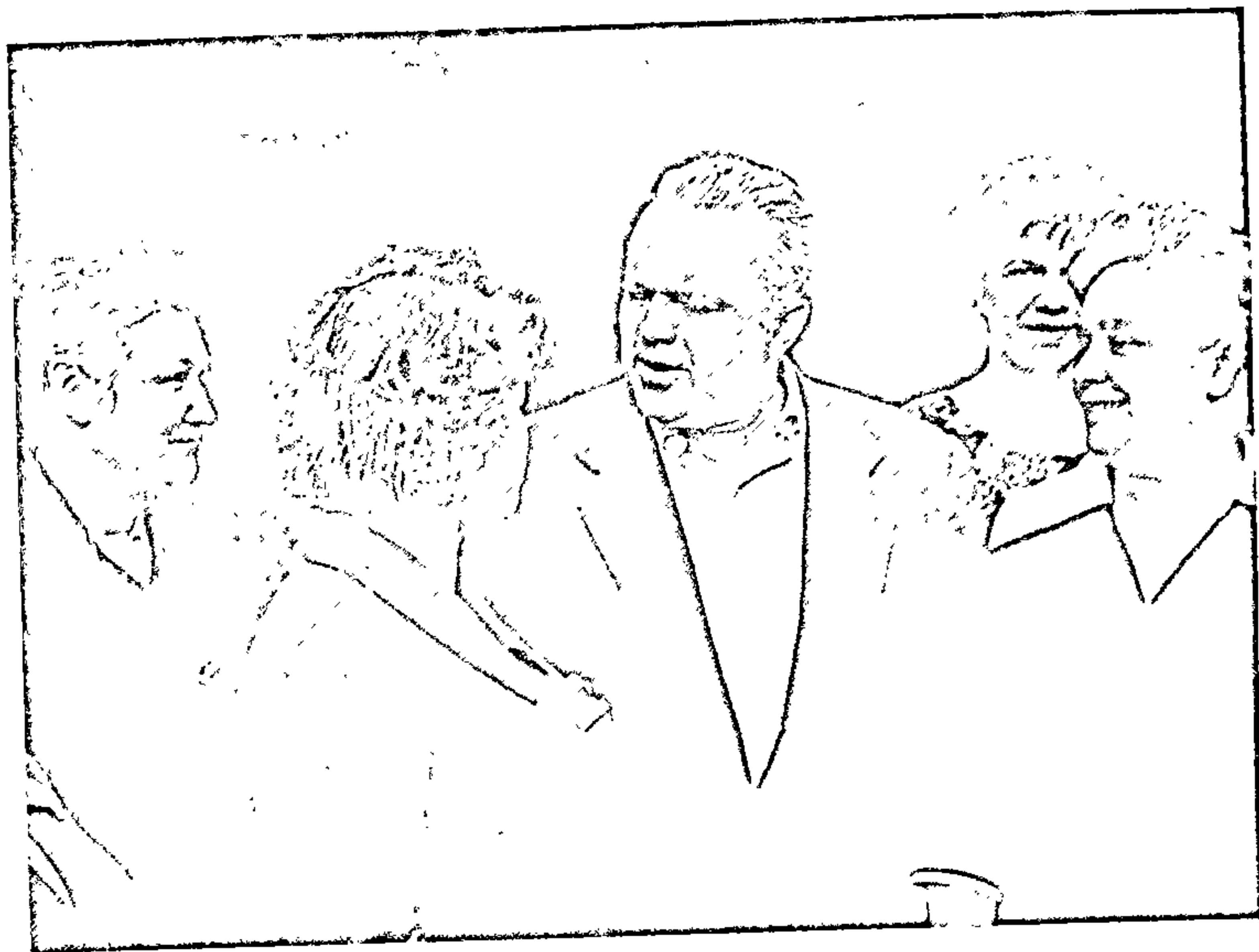
Уладзімір Карпаў на сустрэчы з бібліятэкарамі горада Мінска. 1963 год.