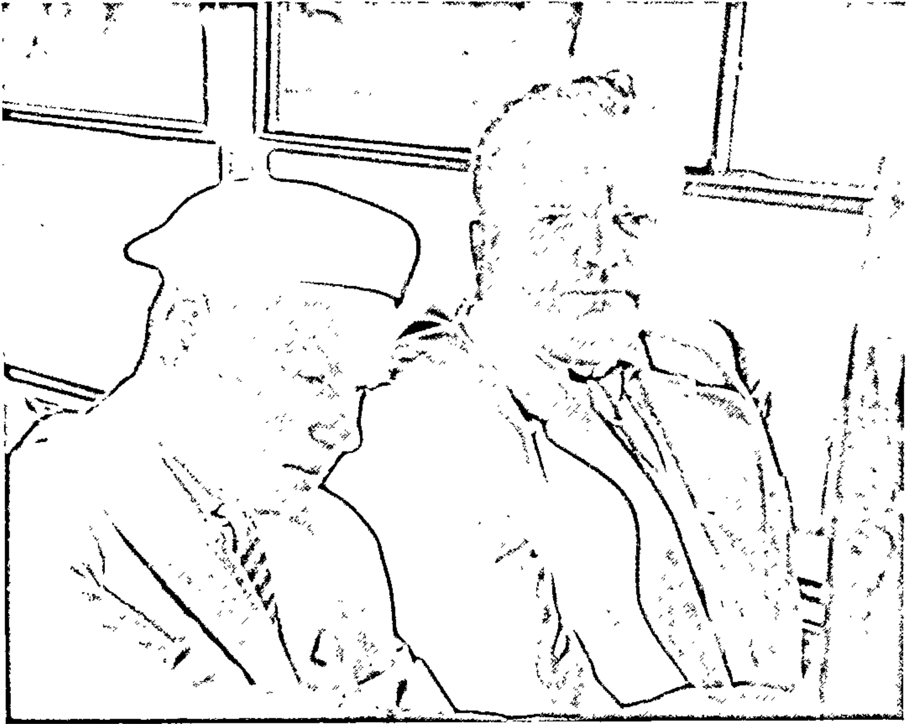
Уладзімір Карпаў і Міхайла Стэльмах. 1962 год.