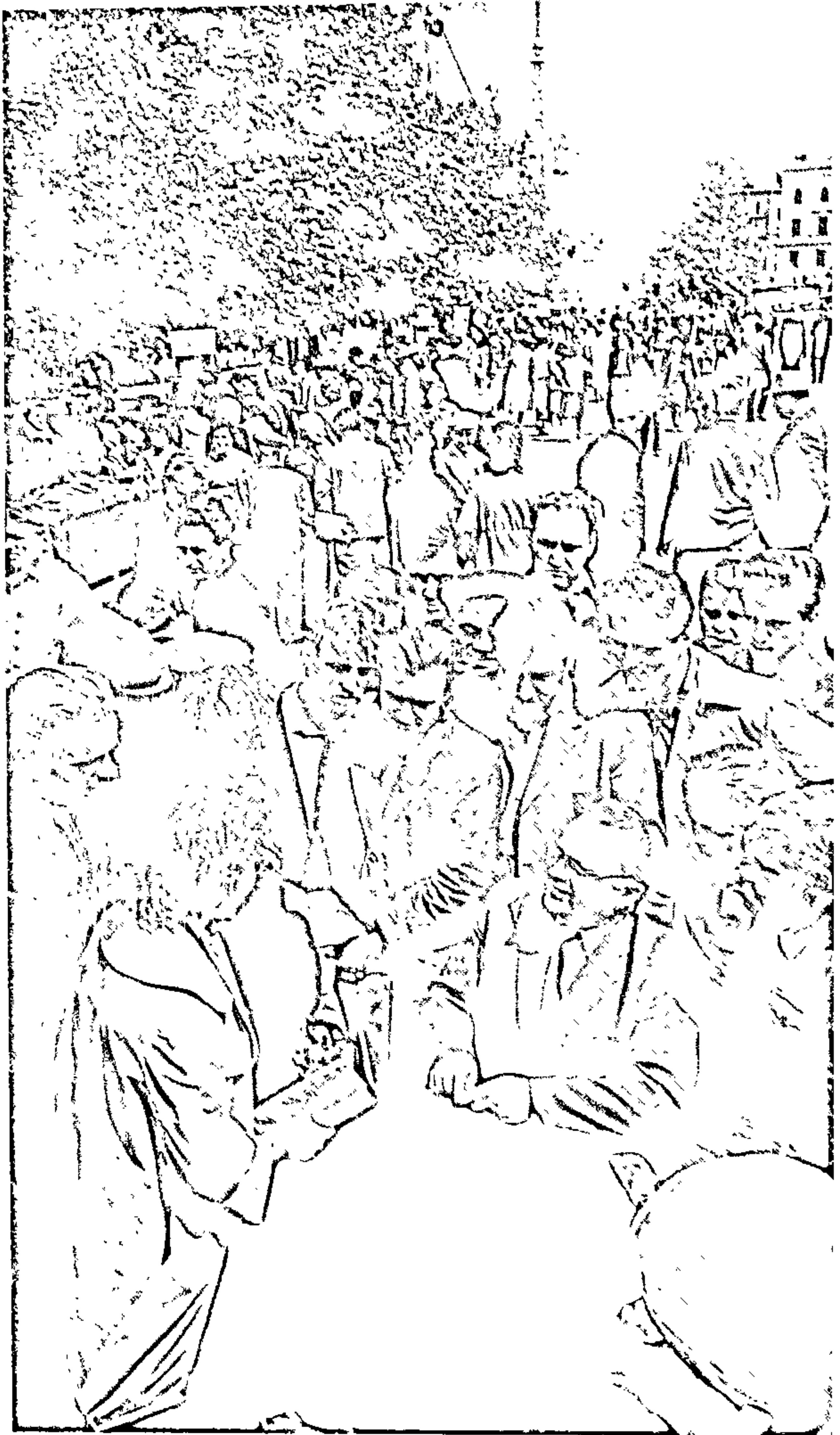
Прыемна атрымаць аўтограф вядомага пісьменніка на свяце кнігі. Мінск, Цэнтральная плошча. 1960 год.